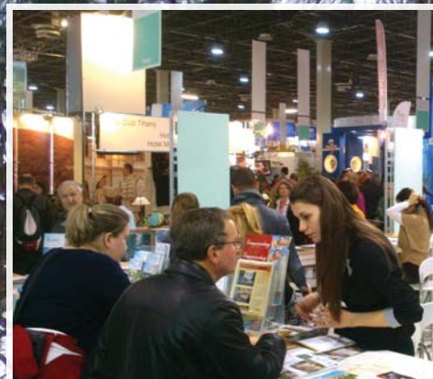
Utazás kiállítás 10. oldal