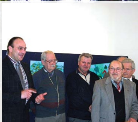
Nőnap ünnepség 9. oldal