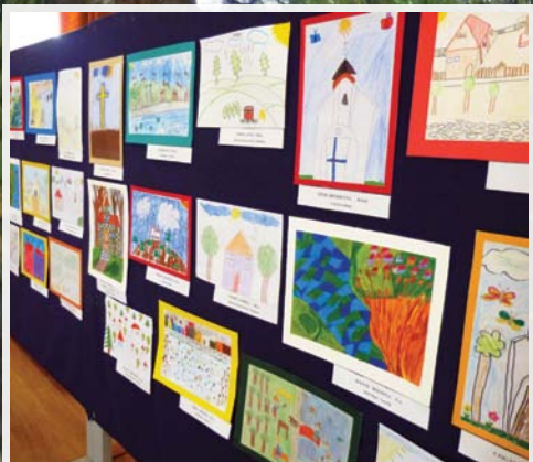
„Szülőföldem” rajzpályázat 9. oldal