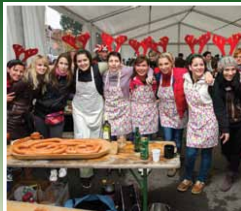
Katalin-napi disznóvágás 10. oldal