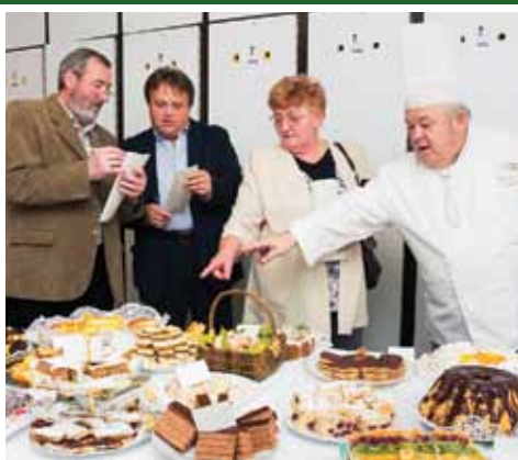
Süteménysütő verseny 8. oldal