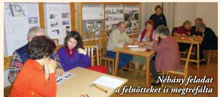
Néhány feladat a felnőtteket is megrézfálta