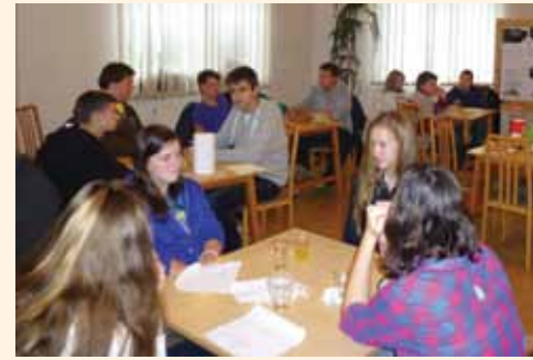
A gyerekcsoportok ügyesen szerepeltek

16-án délelőtt vidám helytörténeti vetélkedőt rendeztünk iskolásainknak, délután pedig a felnőtteknek. Este a Balaton Art Alkotóközösség tagjainak alkotásaiból nyílt kiállítás a Művelődési Ház és Könyvtár nagytermében.