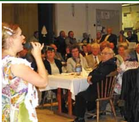
Idősek délutánja 3. oldal