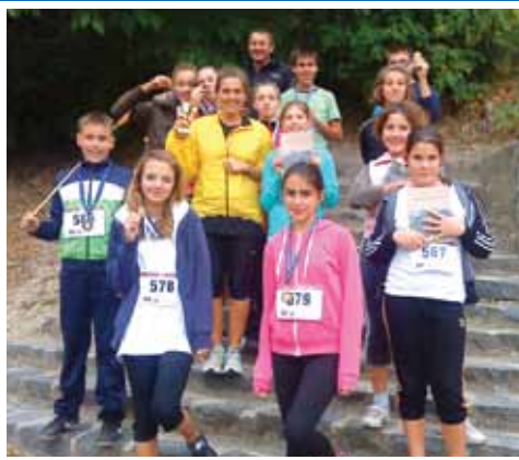
Várfutás Szigligeten 2. oldal