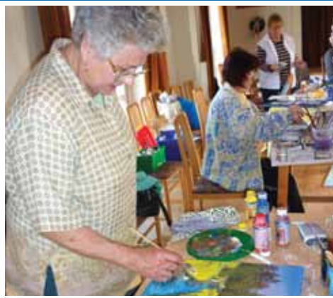
Balaton Art alkotónap 6. oldal