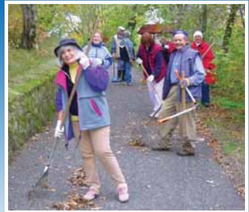
Takarítás a hegyen 8. oldal