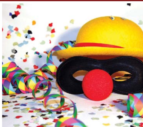
Báli meghívók 5. oldal