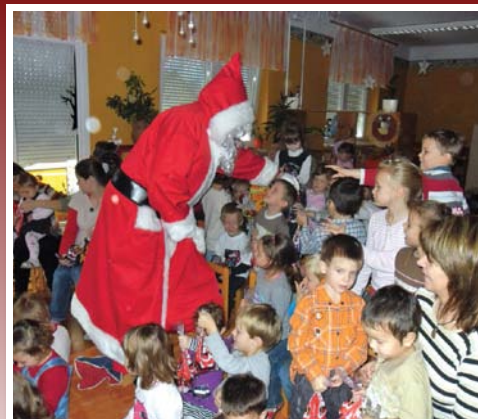
Óvodai hírek 5. oldal