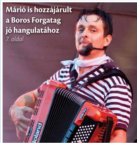
Márió is hozzájárult a Boros Forgatag jó hangulatához 7. oldal