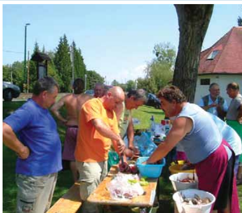
Halász és horgász végre együtt... 5. oldal