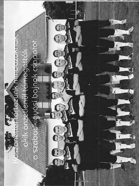
Hozzájárultunk a klubunk támogatásához a klub, önkéntesek támogatásával a szabadkígyósi bajnok csapatot.