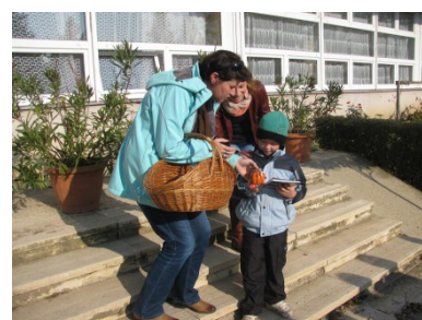
folytatás a 12. oldalon