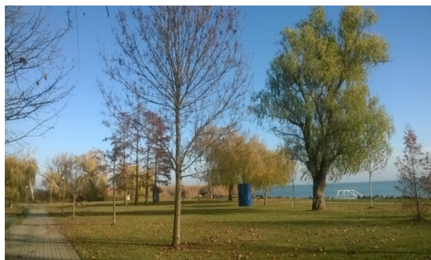
Ábrahámhegy, 2015. november