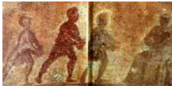
A mágusok hódolata