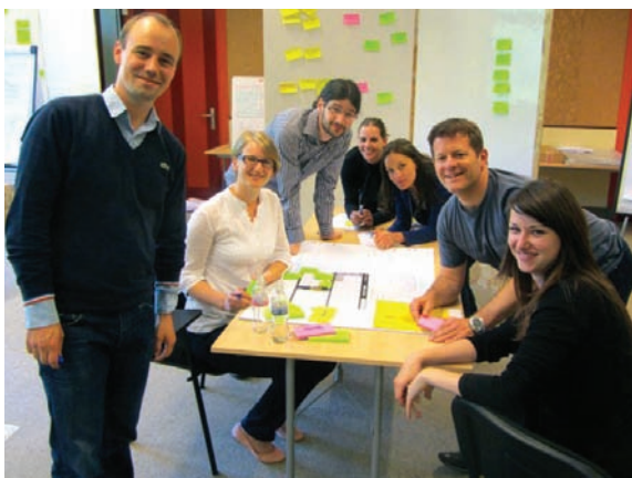
A SMART Pontok tréneiri munka közben

hangban áll a Lisszaboni és a Göteborgi Stratégiák, valamint az Európa 2020 Stratégia célkitűzéseivel, különös tekintettel az Intelligens Növekedés és az Innovatív Unió kezdeményezésekre (SMART Growth and Innovation Union).