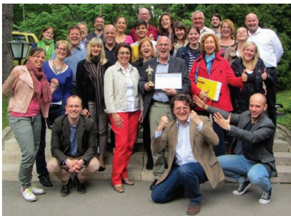
i.e. SMART projekt – a SMART Pontok első tréneinek képzése Dobogókőn 2013. május 13-17.