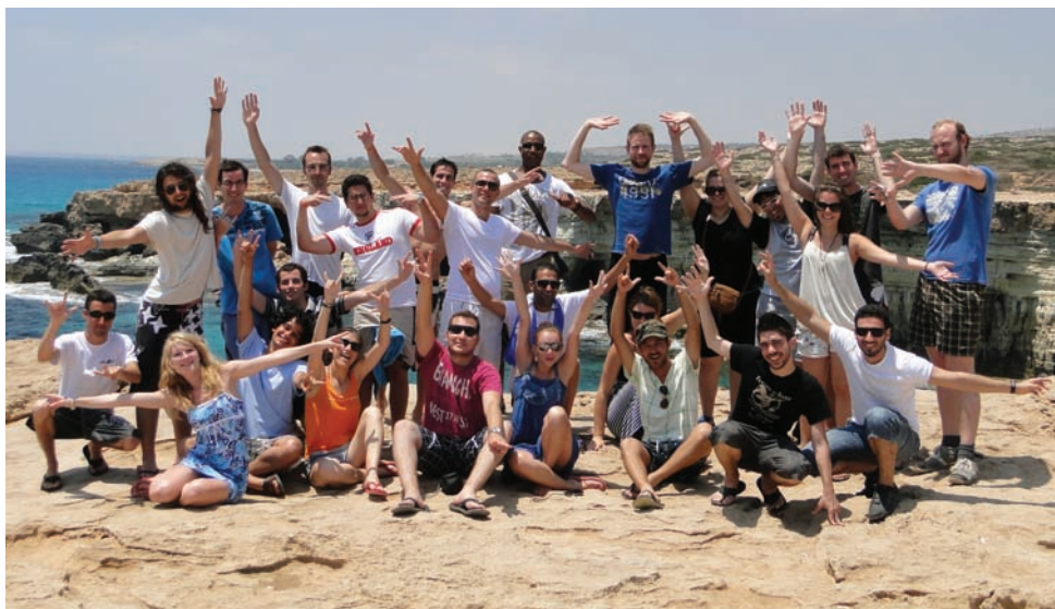
Élmények külföldön a Nemzetközi Szakmai Gyakorlatsere Program keretében

kapcsolatok kiépítésére, a kollégák nyelvi ismereteinek fejlesztésére, a hazaitól eltérő gondolkodás, értékrend és kultúra megismerésére. A külföldön gyakorlatozó hallgató által szerzett szakmai tapasztalatok és élmények támogatják a jövő műszaki értelmiségének fejlődését. Egész évben vannak nálunk gyakorlatozók, de a legintenzívebb időszak létszám és program-szervezés szempontjából a nyár. Ilyenkor a csereprogram részeként rendezik meg a Summer Receptiont, amelynek keretein belül a gyakorlatozók számára napi szinten a lehető legszínesebb kulturális programokat biztosítjuk.