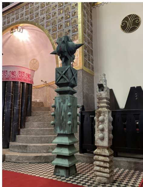
A csúcspdíz, amely felújításra vár; most közlelöl is megnézhetjük

...de ha másra is nyitott szemmel és szívvel nézünk körül, láthatjuk, érzékelhetjük ezt másként is: olyan munkálatok folyhatnak most, amik már régóta szükségesek, s amelyek által korszerűbbé és szebbé válik a lelki otthonunk. Olyan kivitelezésbe foghattunk