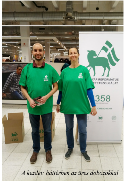
A kezdet: háttérben az üres dobozokkal

„Az ÚR elképesztően tervez, és részt venni az Ő munkájában leírhatatlan kiváltság.”