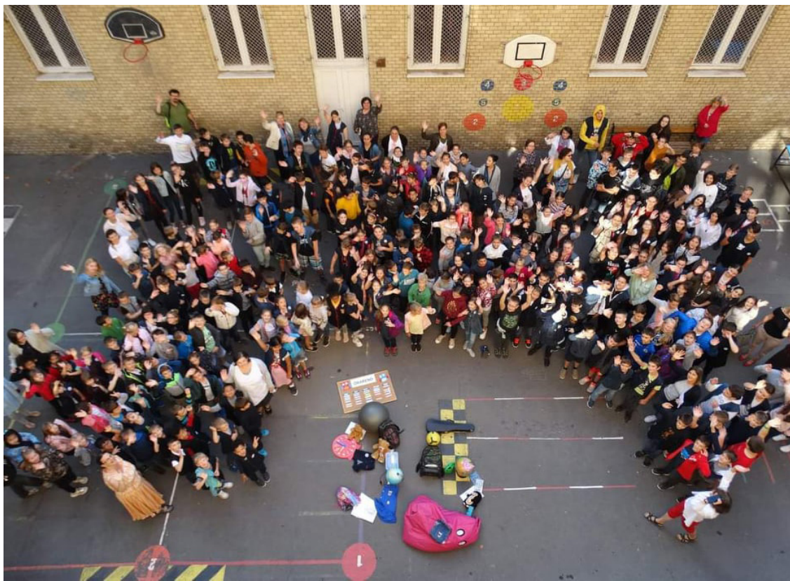
Csoportkép a Julianna 95 éves évfordulóján