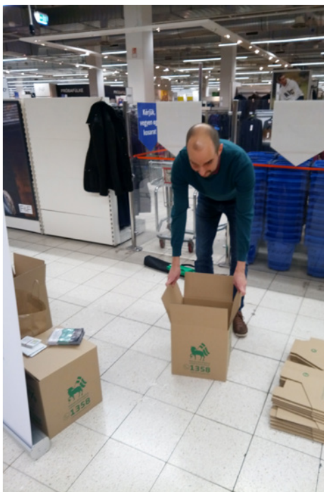
Telnek a dobozok...