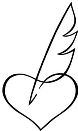
Hangtalan jelek. Simon András grafikája (cikkszám: 0418; a szerző engedélyével)