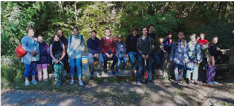
Palacsinta túra 2021 őszén

amely során a gyerekek szórakozva ismerik meg a cserkészlet mibenlétét, történelmét, hazánk életében fontos szerepet játszott személyeit (pl. feltalálói, sportolói), a hasznos csomókat (amiket a nyári táborok során építkezésre használunk), az egészségügyi alapismereteket (pl. stabil oldalfekvés, sebkötözés). Ezen kívül rengeteget játszunk, éneklünk, és időt szakítunk arra, hogy megismerjék saját magukat és társaikat. Fontosnak tartjuk, hogy megalapozzuk és megerősítsük bennük a hitet, továbbá a magyarságtudatot. Ennek érdekében közösen imádkozunk, lelki programokat szervezünk és megemlékezünk nemzeti ünnepeinkről.