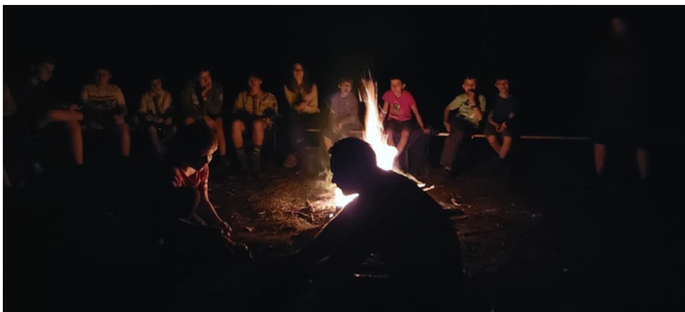
Esti tábortűz a 2021-es táborban

Minden nap megkoronázására a tábortűz szolgál. Vicces játékok, magyar népdalok és cserkészdalok, rövidebb-hosszabb előadások és meghitt hangulat. A tábor alatt a gyerekek azon kívül, hogy közelebb kerülnek a barátaikhoz, újakat is szereznek. Naponta többször is megtapasztalják az Úr közelségét és a ter-