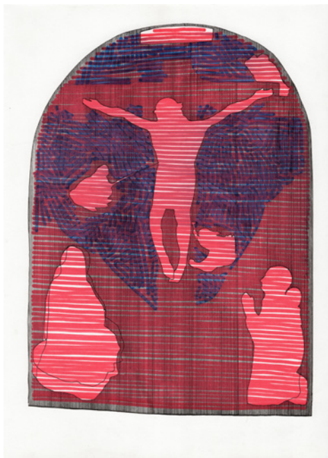
Elvégeztetett! (Giotto után), filctoll, 25 x 35 cm

grafikák, akvarellek, olajfestmények). Ezt a tervet azonban felülírta a pandémia miatti rendkívüli helyzet, melynek következtében hónapokig nem lehetett az egyetemi műterembe bejárni és az ottani eszközöket használni. Márk saját elmondása szerint az otthoni alkotás ugyan technikai lehetőségek tekintetében korlátot szabott, de abban segítette őt, hogy a lényegre tudjon koncentrálni. „Törekedtem arra, hogy mindent elhagyjak, ami a lényeg szempontjából felesleges” – írja Márk a szakdolgozatában. Nem is csak befelé figyelés az, ami ezeket az elmélyült rajzokat meghatározza, hanem a felfelé figyelés: Márk alkotáskor mindig Istenre tekint. Ugyanúgy, ahogyan azt tette több száz évvel korábban egy rendkívüli művész, Giotto, akinek a festményeit Márk inspirációs forrásként használta, sőt újraértelmezte. Giotto korában természetes