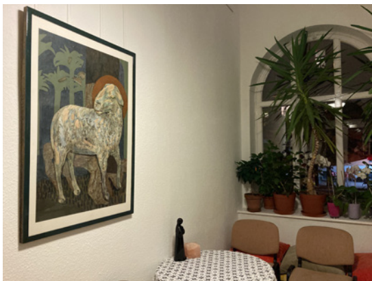
A bárányt ábrázoló festmény

A rajzok témája változatos, rögtön az első teremben Eszter könyvéhez készített illusztrációk voltak láthatók, amelyek eredetileg egy nyári hittanos táborban gyerekeknek tartott alkalomhoz készültek szemléltetésként. A kiállításon az Eszter könyvéből vett igeszakaszok is szerepeltek, amelyek a képeket inspirálták. A nagy gyülekezeti teremben főként Jézus-ábrázolásokat láthattunk (pl. keresztfeszítés-jelenetek Giotto után). A legkisebb, növényekkel berendezett teremben pedig a Barányt