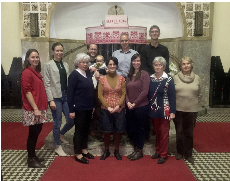
Az újjászerveződött énekkar- a létszám nem teljes, mert nem mindenki tudott a próbán részt venni