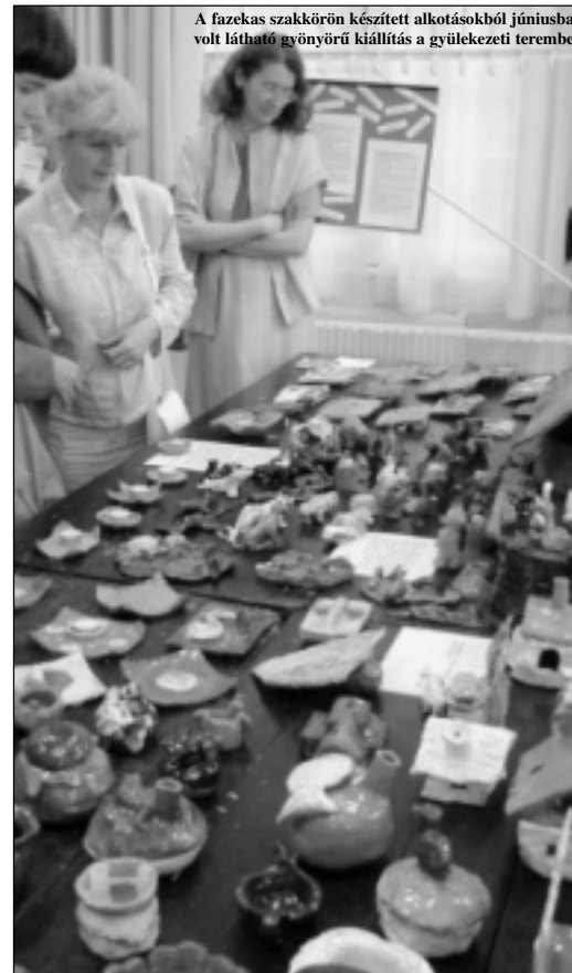
A fazekas szakkörön készített alkotásokból júniusban volt látható gyönyörű kiállítás a gyülekezeti teremben

Ne legyek igazságtalan! Sok ember – aki magától nem tud tervezni, nem olyan ügyes a keze, nem olyan gazdag az alkotó fantáziája – kap kedvet így az alkotáshoz, neki is sikerülhet az, ami másnak. Ezzel nincs is semmi baj, ha értjük, hogy ez kézimunkázás, hasonló a maga sokféleségében is, nagyanyáink előnyomott hímzés-, gobelin-mintáihoz. Ha nem tévesztjük össze az igazi ALKOTÁS-sal. Mert az valami más. Az igazi agyag igazi égéshőfoka 900 Celsius fok körül kezdődik. Az 1000 fok alatti mázakat ala-