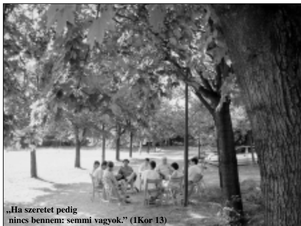
„Ha szeretet pedig nincs bennem: semmi vagyok.” (1Kor 13)

Bizony többen úgy érkezünk a táborba, hogy legszívesebben visszafordultunk volna útközben: „alig isme-