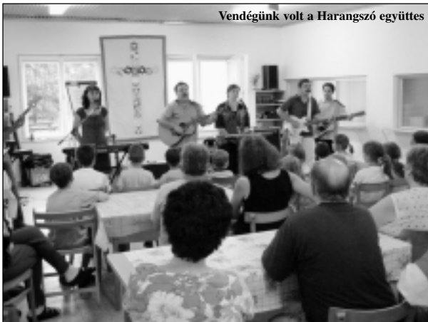
Vendégünk volt a Harangszó együttes

hitem, hogy Ő tanít engem, a hitemhez pedig az Úr kegyelme, az hogy meghallgatta könyörgésem, hogy munkáljon bennem. És ezután már lesz az én hitem szerint, amely hit belőle, és nem belőlem fakad.