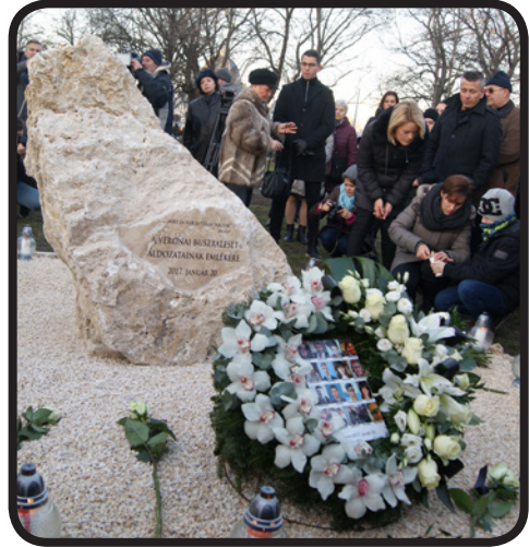
Az emlékezet kövének avatása a Múcsarnok mögött