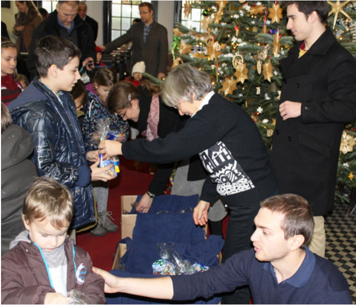
Karácsonykor a gyülekezet ismét megajándékozta a gyermekeket az istentiszteleten