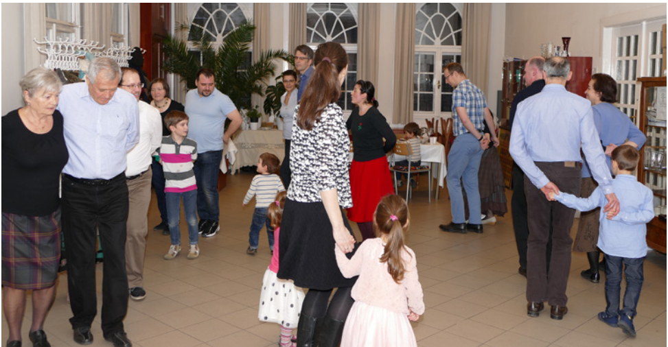
Február 11-én néptánc tanításon vehettek részt kicsik és nagyok a Szabó Imre teremben.