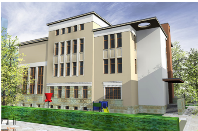
Az új óvoda látványterve

Miközben évek óta imádságunk a Csipkebokor óvoda fejlesztése, és pályáztunk is különböző uniós forrásokra, ebből a hirtelen jött kormányzati támogatásból megvalósulhat ez az álmunk is. Arra is futja belőle, hogy a régi Julianna-épületből korszerű, minden igényt kielégítő, hatszobortos óvodaépület szülessen. A tervek gyönyörűek, az építkezésnek a küszöbén állunk, imádkozunk érte. Nyáron átköltöztek az itt élő óvodai csoportok a Rottenbiller utcai iskolaépületbe, és ezzel párhuzamosan az iskola szépítésére is sor kerülhetett, különös tekintettel a tornateremre, de volt festés, mázolás, klímaszerelés is. Két adat, melyet a gyülekezet talán nem is sejt: jelenleg 321 diák jár a Julianna iskolába, és 113 ovisunk van a Csipkebokor óvodában! Mintegy 400 család! Milyen hatalmas az Úr! Áldott legyen érte!