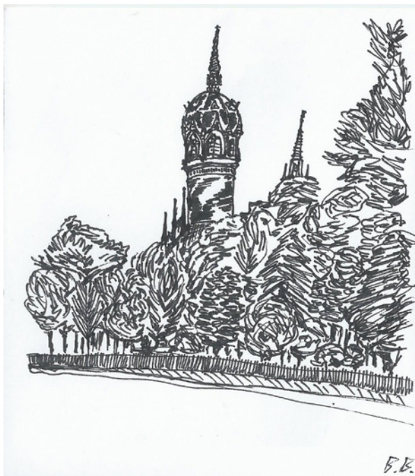
A wittenbergi Schlosskirche, a reformáció indulásának helye – Berzsák Bulcsú rajza a tavalyi kerékpártúráról