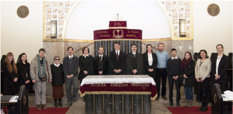
Február 18-án tettek fogadalmat felnőtt konfirmációs csoportunk résztvevői. Egyikük bizonyágtétele alább olvasható.