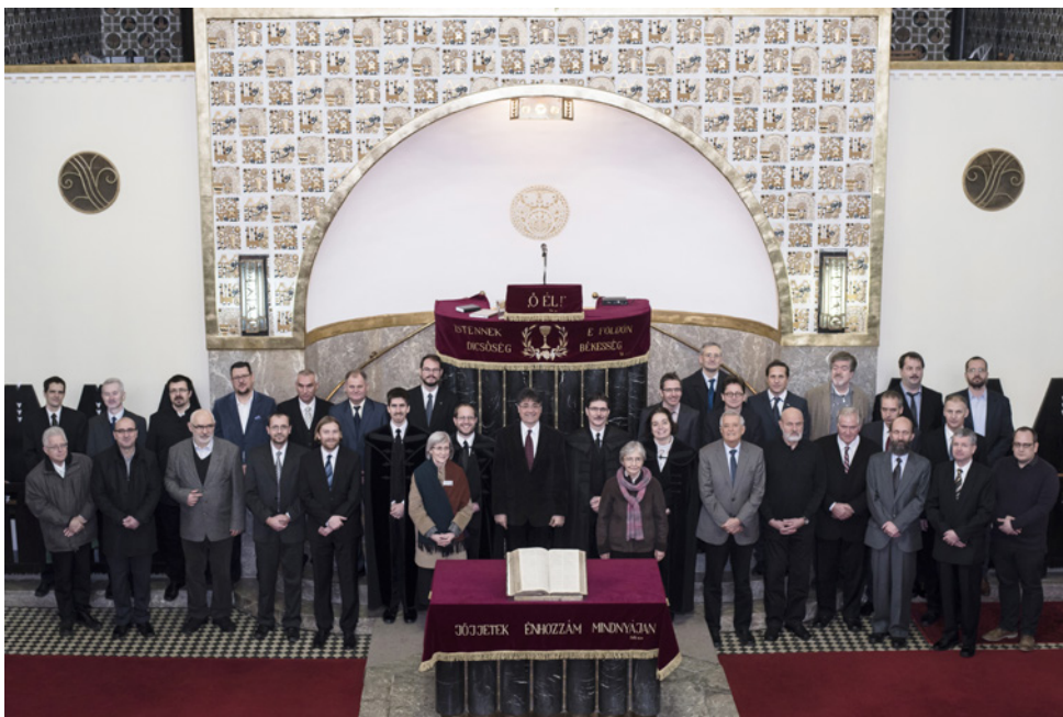
A megújult presbitérium