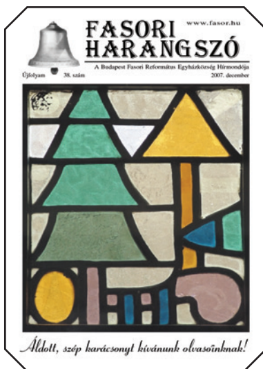
Az első színes címlap 2007-ből