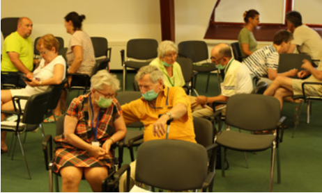
Házaspáros beszélgetések az előadás után