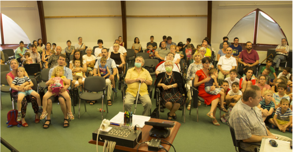
„Már anyaölbén is...” Együtt, felfelé nézve