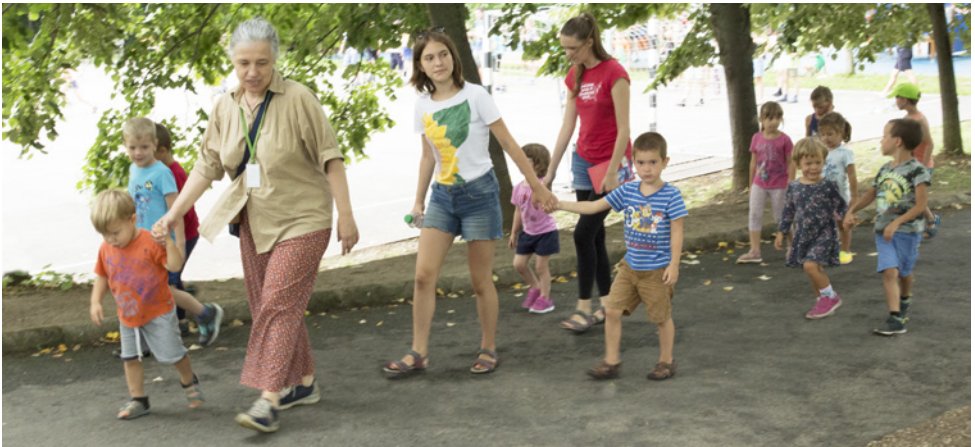
Mi az Úrhoz megyünk. Kicsik és szolgáltók