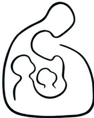
Isten alkototarsai. Simon András grafikája (cikkszám: 1691; a szerző engedélyével)

V.Zs.: Sem a férjem, sem én nem szeretünk gyűjtögetni, tárolni éveig dolgokat. Ezért, amit két vagy három éve már nem használtunk, illetve amire már nincs szüksége a lányunknak, azt mindig elajándékozunk olyan családoknak, ahol nagy hasznát veszik. Például a karantén ideje alatt egyik ismerősöm eladta a házat, jóval kisebb lakásba költözött. Felhívott telefonon, hogy van rengeteg ruha, cipő, játék, könyv, ami náluk felhalmozódott huszonöt év alatt, tovább tárolni nem tudja, kidobni nem akarja. Szerette volna, ha olyan családokhoz jutna, akiknek szüksége van rá,