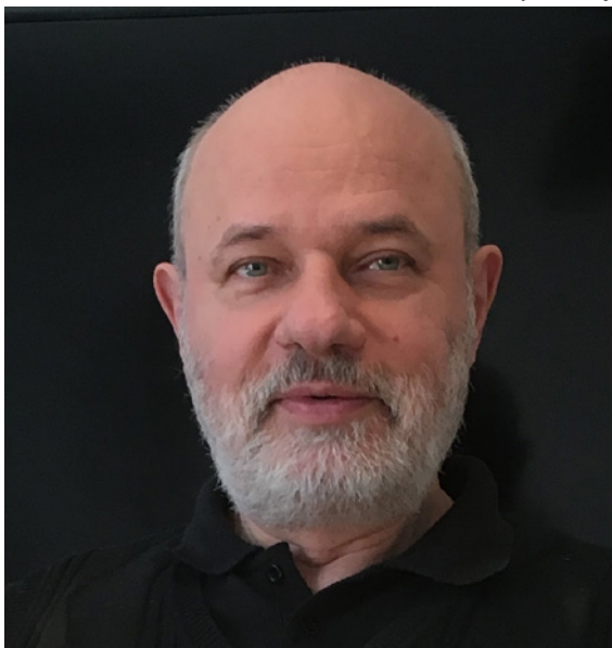
Egyre visszhangzott bennem: „Veled leszek!”