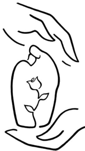
Gondviselés. Simon András grafikája (cikkszám: 1366; a szerző engedélyével)