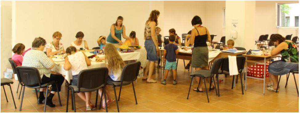
Ügyes kezekkel. Életkor nem számít