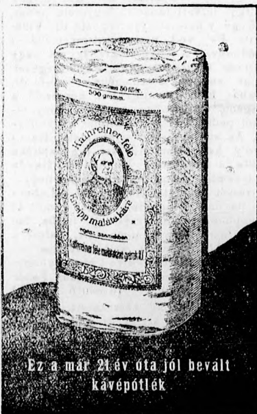
Ez a már 21 év óta jól bevált kávépótlék

* Mozgalom adóhivatalért. A szabályi járás 5 községe Z-abya, C-örög, Nádálja, Boldogasszonyfalva és Sejasgyörgye községek már regebben indítottak mo-galmat adóhivatalért. Ez ügyben hozzájárulási öszsegeket is megzavattak. Ezen határozatokat a vármegye tlvhatósági bizottsága most jóváhagyta.