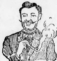
Fő- és mellpasztillák csak hamar meggyógyítják!