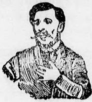
Megfojt ez az átkozott köhögés!