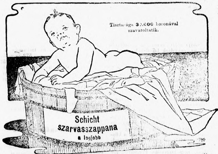
Tiszta ága 32.000 koronával szavatoltatik.

Schicht szarvas jegyű szappánát rendkívül kitűnő tulajdonságainál fogva előnyösen használhatjuk minden elgondolható mosási célra: személyes használatra, legfinomabb és durva, fehér és színes vászonneműek mosására, konyhadények, bútorok, aszénnyek, háziállatok tisztítására stb. stb. A legjobb kiválasztott nyersanyagokból lesz előállítva.