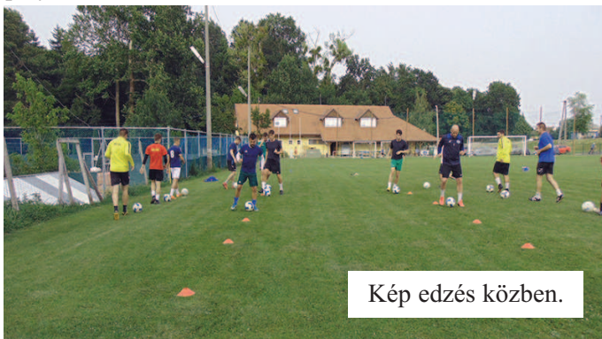
Kép edzés közben.

Bajnok lett a Rummal, valamint elnyerte a Szabadföld kupát is, szintén a Rum csapatával. A célokról annyit árult el előzetesen, hogy minden meccsen győzelemért lépünk pályára!