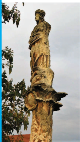
Répceszentgyörgy Mária szobor restaurálás előtt