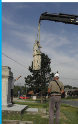
Vép Mária szobor a restaurálás kezdetét vette!