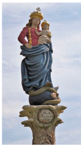
Répceszentgyörgy Mária szobor restaurálás után