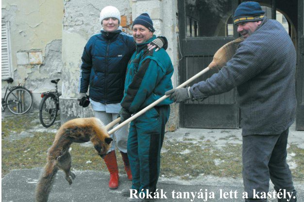
Rókák tanyája lett a kastély.