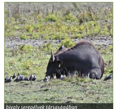
bivaly seregélyek társaságában