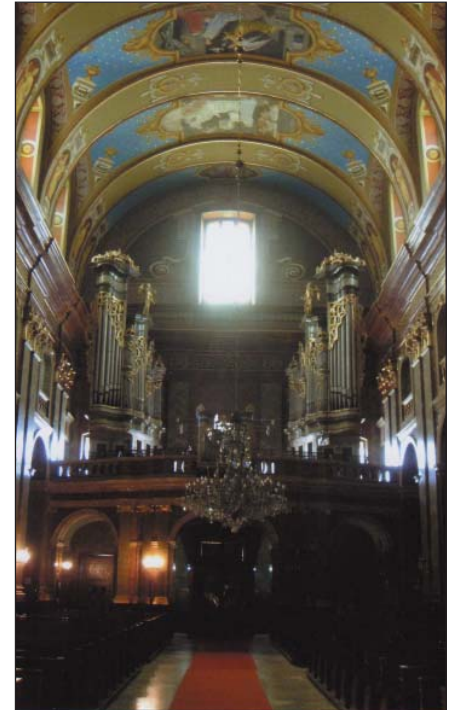
A Basilica nemrég felújított főhajója az orgonával

említi. 1091-ben a kunok Bihar várát feldúlták, akkor Szent László a püspökség székhelyét a védhetőbb Körös-parti területre, a későbbi Váradra helyezte át. Mindez 1091-93 között történt, amihez kötődve a váradi hagyomány 1092-t fogadta el a püspökség és ezáltal közvetve a város megalapításának konvencionális