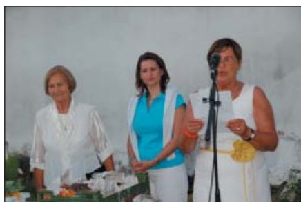
A képek a díjátadó ünnepségen készültek

A fenti meghatározásból kitűnik, hogy a kert határozott funkcióval, használati értékkel rendelkezik. Ez a pályázaton résztvevő valamennyi kertről kivétel nélkül elmondható. Többségében pihenőkertekkel találkozunk, de akadt kimondottan haszónkert is, ill. ahol a kettő ötvöződött. Elégedetten megállapíthatjuk, hogy a megtekintett kertek mindegyikét szívvel-lélekkel, fáradságot nem ismerve alakította, formálja és gondozza ma is tulajdonosa, örömeiket lelik kertjükben, mindannyian szeretik a szép, egészséges növényeket, a különleges részleteket. Kertjük méltó módon keretezi, erősíti házukat.