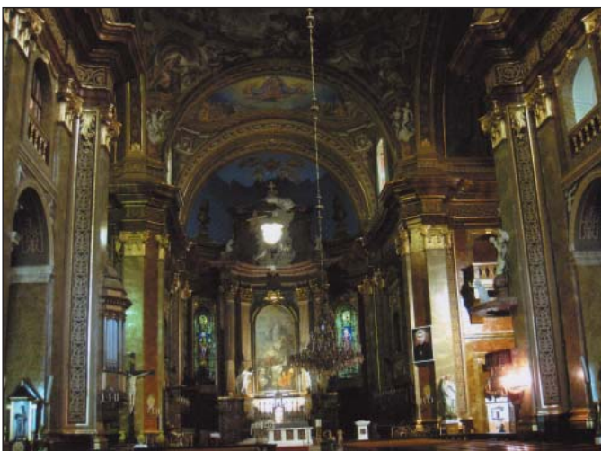
A Basilica nemrég felújított főhajója az oltárral

egy váratlan és gyors csapás vetett véget, a tatárjárás 1241-42-ben, melyben a város lakosságának közel fele elpusztult. A pusztítást leíró fő forrás Rogerius, váradi kanonok műve, a Carmen Miserabile (Siralmas ének). Részletek taglalása helyett csak annyit, hogy az