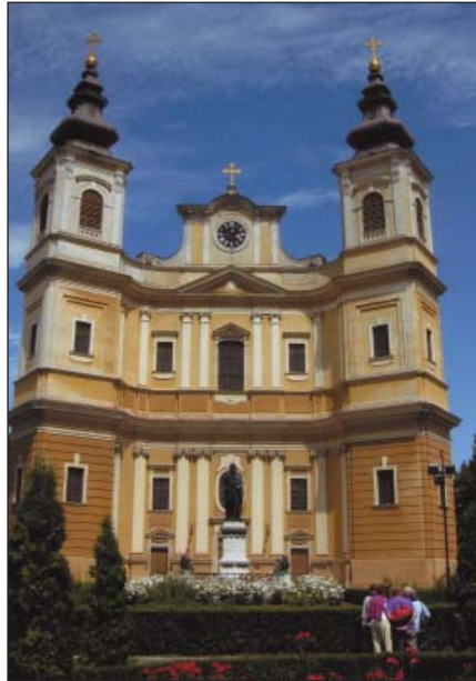
A székesegyház (Basilica minor) 1780-ban szentelték fel