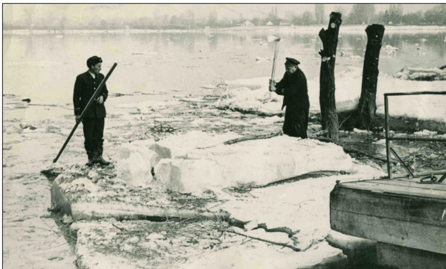
Jéggyűjtés a verembe a surányi csárdának