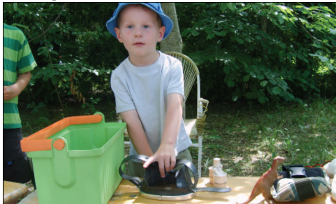
Bolhapiac – az egyik legifjabb árú