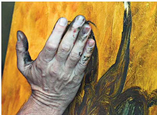
3. ábra. A kezem - látványfestés a LGOCA galériában