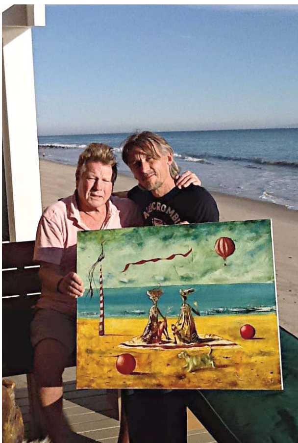
1. ábra. Ryan O'Neal a malibui ház teraszán

Előre szóltak, hogy Ryan szomorú, mogorva pasas, aki csak úgy lézeng a világban, mióta párja, a Charlie-angyal Farrah (ki ne emlékezne szőke hajzuhatagára) már nem él, egyetlen öröme Mozart névre hallgató kutyája. Ehhez képest egy szimpatikus, minden külsőségtől mentes, szinte átlagosnak tűnő embert láttam felém sétálni a malibui strandon, ahol a háza áll. Én a színész teraszán vártam, ő pedig a főnyenyen baktatott Mozarttal játszva. Idillikus kép volt, a háttérben a morajló óceánnal... Abszolút festő ecsetjére kíváncszott... De hát azért jöttem, hogy ez a kép a vászonra kerüljön. Persze csak nagyjából, mert én nem tájképeket készítek, hanem az álmaink tájait, jelen esetben kicsit Ryan és az én álmom ötvözését készültem megfesteni. Ryan 70 felett lehet, bár ez nem látszik rajta, köszönhetően talán az amerikai plasztikai sebészeknek, de ne rosszmájúskodjak vendéglátómmal, inkább megemlítem, hogy a teraszon ott lógott egy nagy bokszsák, amit saját elmondása szerint naponta püföl. Na ja, köny-