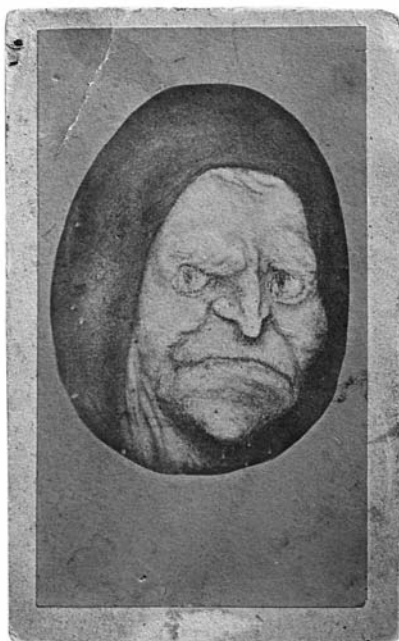
1. ábra. Szathmári Pap Károly reprodukciója egy rajzról/festményről. 1860-as évek, albumin vizitkép