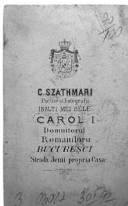
2. ábra. A reprodukciós fénykép hátoldala