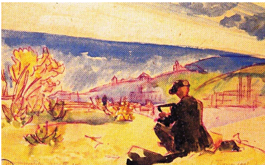
Tipary fest a Margitszigeten, 1922