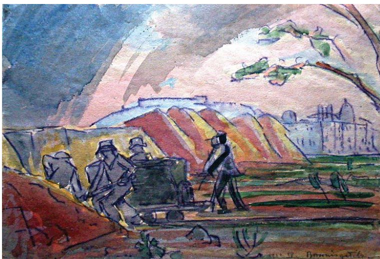
Munkások a Margitszigeten, 1922