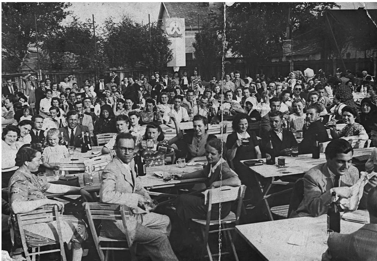
Rendezvény a gyár dolgozói számára 1930 körül

sias” hangnem uralkodik mind a levelezésben, mind a személyes kapcsolatok dokumentációjában.