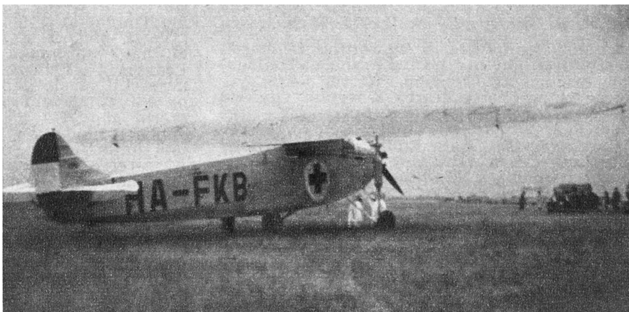
Az átalakított Fokker VIIIB repülőgép Mátýásföldön az indulás reggelén, előtte fehér ruhában az ugró csoport

A bátor hölgyeket Czékus Ferenc százados, a 2/1 bombázószázad parancsnoka készítette fel az ejtőernyőzésre. A kiképzés részeként először kis sportgéppel, majd – ejtőernyővel a hátukon – csapatszállító repülőgép-