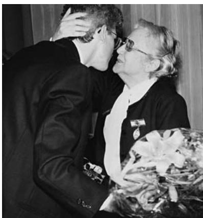
A díszpolgári cím átvételekor 1993-ban