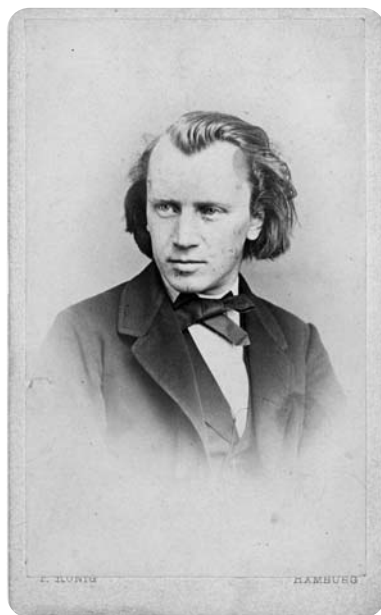
Johannes Brahms 1862-ben

Leszámítva az útjába kerülő vagy mások ál-