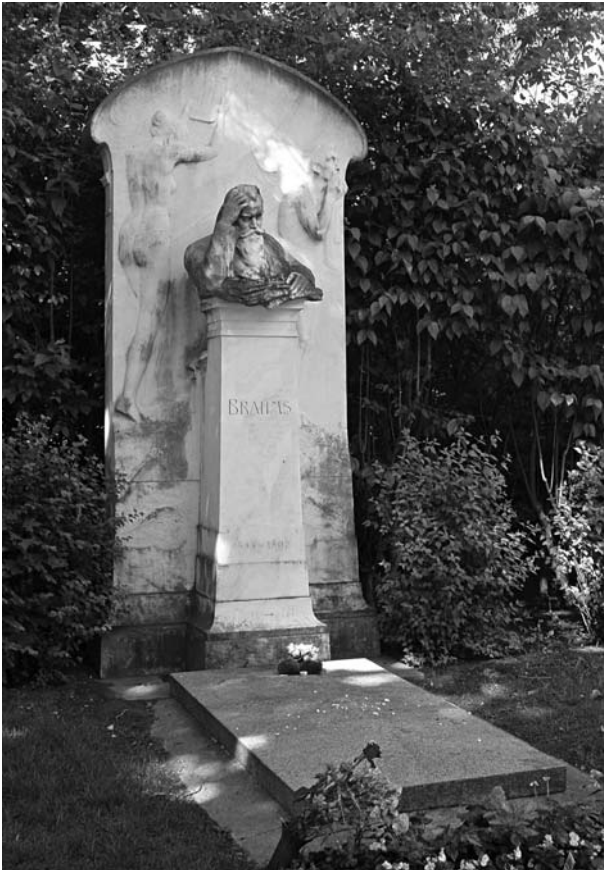
Brahms sírja Bécsben

Utolsó éjszakáján orvosán kívül háziasszonya volt mellette, akinél 1872 óta lakott. Éjfélkor nyugtalan lett, fájdalmai miatt morfiumot kapott. Hajnali 4 óra körül újból nyugtalan, ekkor egy pohár Rajna-menti vörösbort adtak neki, amit megivott és egy „Ah, de jól esett!”-tel nyugtázott. Ezután elcsendesedett, majd reggel fél 9-kor, mikor Frau Truxa a beteg ágyához lépett, az alvónak hitt Brahms kinyitotta a szemét, némán, szomorúan nézte, aztán... beesett arcán könnycseppek gördültek alá, majd egy mély lélegzetet véve örökre eltávozott.