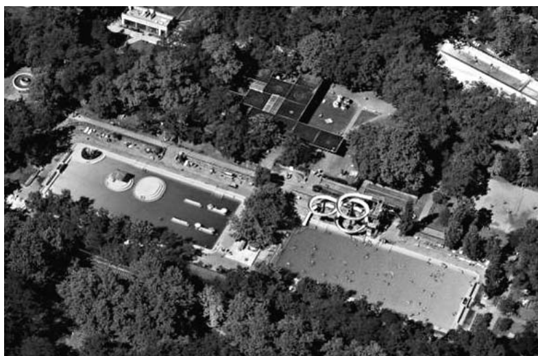
2. ábra. A Nagyerdei Gyógyfürdő termálvizes strandja madártávlatból. A két nyitott termálmedence 1932-ben készült el

A város a fürdőház építését 1824. július 31-én rendelte meg, melyre Povolny építőmester 15 380 Ft-os árajánlatot adott. Ez magában foglalta a fürdő és a vendéglő terveit és kivitelezését is. A munkát 1824-ban kezdték meg, és az épület 1826. május 1-jére el is készült. A tényleges összköltség, láss csodát, 15 380 Ft volt, pedig a környéken építőanyag alig lévén, a követeket Egerből, a faanyagot meg a hegyekből szállították. A pilléres, timpanonos épület a Nagyerdő egyik ékköve lett (1. ábra). Simonyi