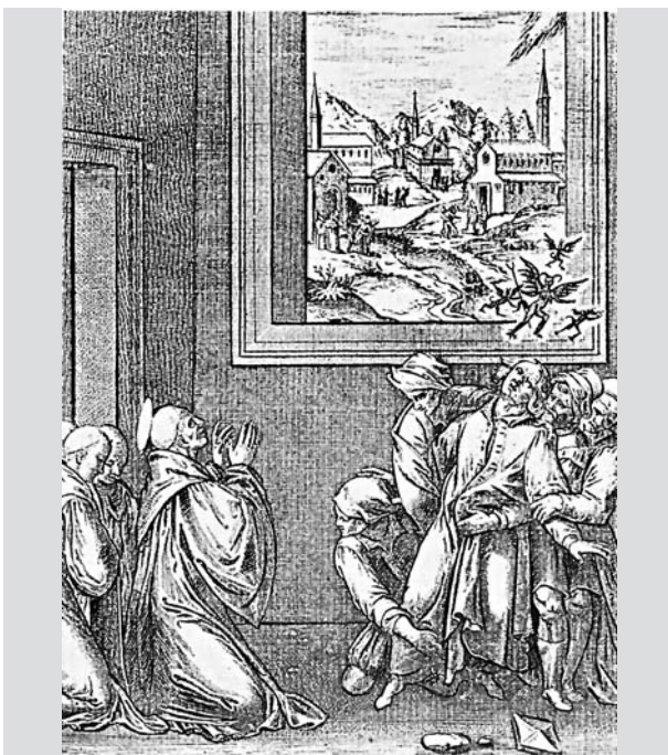
5. ábra. Szent Benedek kiűzi az ördögöt a megszállott fejéből. Rézmetszet, 1579

zog. Marokkóban az epilepsziában szenvedőket „mejnun”-nak hívják, a dzsinnek által megszállottaknak, Szenegálban ugyanígy dzsinneként emlegetik őket. A megszállás alatt erős görcs rázza a testet, és a természetfeletti médiumként használja áldozatát. A melanéz kultúrában haragos ősök vagy ördögi lélek szállja meg a beteget. Zimbabwében a bantuknál és Madagaszkáron hasonló a tradíció.