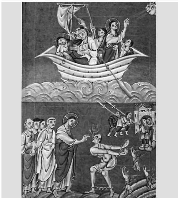
3. ábra. „Menj ki, tisztátalan lélek, ebből az emberből.” Miniatura III. Ottó evangéliumból

Amerikában a prekolumbián azték és inka kultúrákban Poma de Ayola krónikáiból ismerjük az epilepsziát. Az inka birodalomban is megjelenik a Hold szerepe, a halál képe, a betegséget „aya huayrá”-nak, a halál leheletének hívták, vagy Tucin, az éjszakai madár támadá-