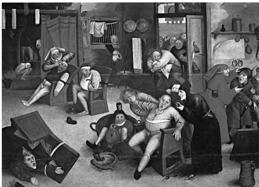
7. ábra. Id. Pieter Bruegel: A betegség kimetszése, XVI. sz. Saint-Omer

alatt nem sokat változott. Talán a kollektív tudattalan tartja fogva ezeket a babonákat, mítoszokat, talán az ismeretek hiánya.