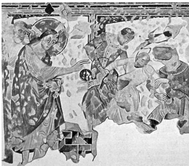
1. ábra. Krisztus meggyógyít egy epilepsziást. Freskó, XI. század. Überlingen, Goldbach-kápolna

zonyos empirikus tapasztalaton alapult. Korai elnevezése a morbis lunaticus erre utal. A hold démoni szerepe az ókori római és görög kultúrkörben is megmarad, hiszen a 28 napos holdfázisokat ők is észlelték már. A hermetikus írásokban Hermész Triszmegisztoz megállapítása szerint: „Ami fent van, az lent is, ami lent, az fent is.” Ez a kozmológiai gondolkodás arra utal, hogy azt tartották, az emberben megismétlődnek a kozmosz szabályai. A theurgikus szemlélet még uralkodó, a betegségek isteni, démoni eredetűek. Úgy gondolták, az epilepsziást Szeléné, a Hold istennője sújtja, de megjelenik Mars és Hekaté is, akik a roham és az alvilág metaforáit kapcsolják a betegséghez. A külső démoni erő villámszerűen lesújt, leteperi, görcsös viaskodásba kezd a megszállott beteggel, majd legyőzi, magatehetetlenné teszi. A roham utáni mozdulatlanság, magatehetetlenség a külső szemlélőben halálélményt hoz a felszínre, ami ijesztő és félelmetes.