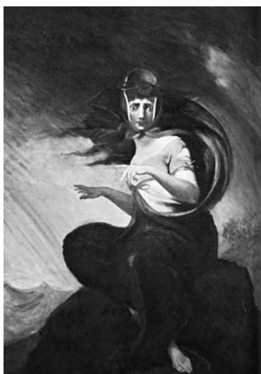
8. ábra. Füssli, J. H.: Őrült Kata, 1806. Az epilepsziát az elmebetegségek közé sorolták

spirituális természetgyógyász, pszichoterapeuta Rüdiger Dahlke A lélek nyelve: a betegség című könyvében arról ír, hogy az epilepszia feltétlen a pszichiátriai betegségek közé tartozik, a roham alatt a tudat egy másik, nem tudatos síkkal csap össze, a betegekben felhalmozódott düh akar előtörni, a szájuk is a dühtől habzik, zuhanásukban megadják magukat az ismeretlen hatalomnak. A roham kegyetlen harc. A roham alatti bélsárürítés pedig Hádész birodalmára enged következtetni. A duzzasztógát átszakadásához, a földrengéshez hasonlítja a betegséget és a rohamokat. Ezzel a XX. századi irodalom tovább bővíti az ijesztő, démoni, militáns, katasztrófális metaforák körét. Azt mondhatjuk, hogy a félelmet keltő, szégyent okozó, stigmatizáló elméletek, ártó mítoszok átöröklődtek, a betegség megítélése ötezer év