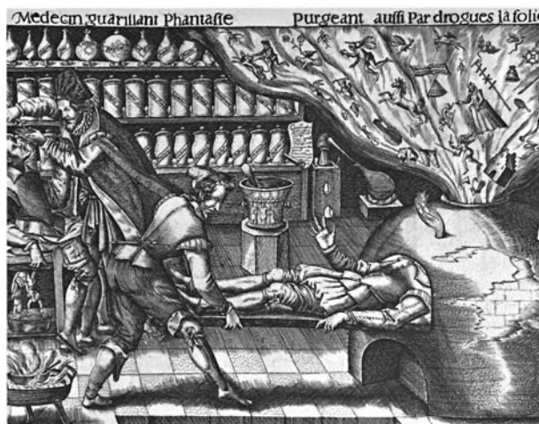
6. ábra. A betegség kiűzése a laboratóriumban. Rézmetszet, XVII. század

A késő középkorban az epilepsziát démoni és fertőző betegségnek gondolták, ezért a beteget eltiltották a szentáldozástól, nehogy megszenteltelítse és megfertőzze a kupát és a tálalt. Az a képzet, hogy az epilepszia fertőző, túlélte az évszázadokat, Ruahában ma is külön telepeken élnek az epilepsziások. A betegek sok-