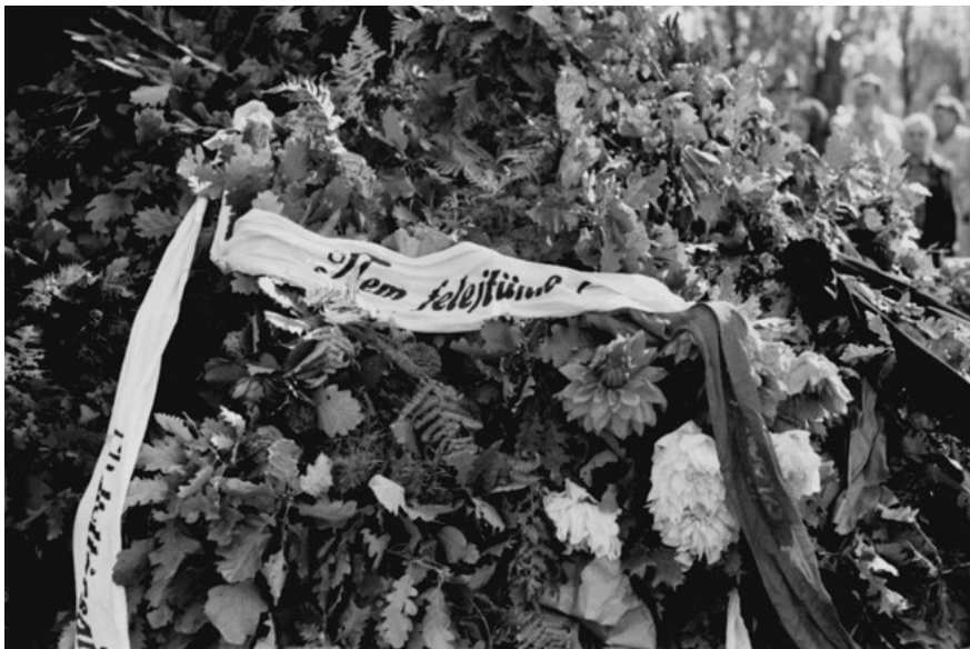
Koszorú Rajk László és társai újratemetésén, 1956. október 6-án a Kerepesi temetőben. Németh László szerint a politizáló embert „az amúgy is sejtett tényeknél sokkal jobban érdekelte, hogy beszélni lehetett róluk”.