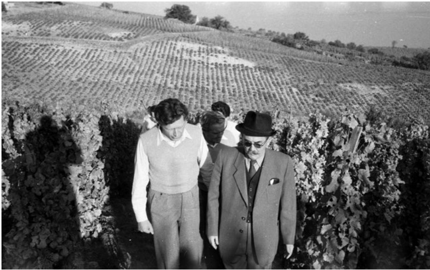
Nagy Imre a badacsonytomaji szüreten, 1956. október 22-én. „Németh pontosan látta az ellentmondás lényegét: Nagy Imrének kommunistiként kellett a hatalmat gyakorolni a forradalom idején, amelyet a kommunista zsarnokság elleni közös harc tartott egybe.”

uszításnak: Nagy Imrének, akivel még Budapesten is a maguk eszét követő felkelő csoportok néztek farkaszszemet, aligha sikerülhetett a tejként kifutó eszméket a kommunista föld alá visszafogni.” 27