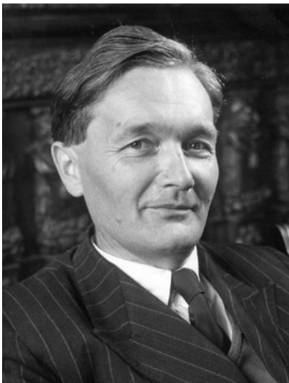
Németh László 1956. október 14-én. A forradalom híre a szigligeti alkotóházban érte.

Németh László joggal vonta le a következtetést az 1945. novemberi választások alapján, hogy a magyarság nem proletár átmenetet akar, hanem némi függetlenséggel, vagyonnal, polgárosodási hajlammal együtt járót, amelyből a társadalom proletarizálása nélkül lehet eljutni a szocializmusba. Ez a felfogás messze elütött a kommunisták szocializmus-fogalmától, melynek lényegét nemegyszer megfogalmazták: „népi demokráciával a proletárdiktatúráért”. 10 Németh