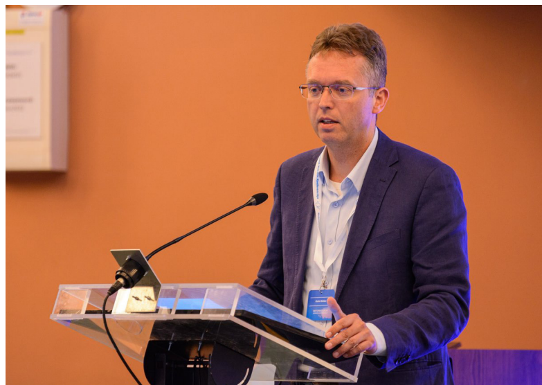
Hankó Balázs államtitkár a hittudományi képzés kovászszeréről beszélt.

Hankó Balázs innovációért és felsőoktatásért felelős államtitkár a felsőoktatás egy különleges területe, a hittudományi képzés címmel tartott előadást, amelyben arról is beszélt, hogy a hittudományi képzések hogyan tudnak kovászként hatni a nemzetben az egyetemek révén.