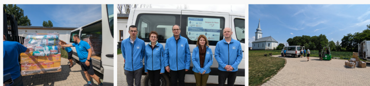
A VIII. és IX. segélyszállítmányaink Kárpátjára 2023 áprilisában és júliusában

Az idei tanévzárást követően – június 19. és