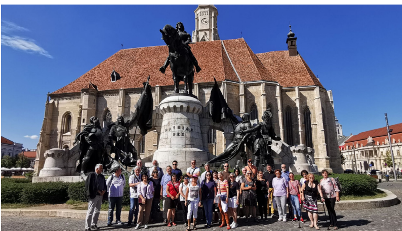
Kolozsvár, 2023 szeptember 2

Az előadáshoz Balog Zoltán dunamelléki püspök, a Zsinat lelkészi elnöke is hozzászólt, hangsúlyozva, hogy hosszú utat tett meg a hittudományi képzés az elmúlt évtizedekben, korábban ezeket nem nagyon tekintették egyenrangúnak a többi felsőoktatási képzéssel, és ez számtalan gyakorlati nehézséget is okozott. A püspök szerint mára ez sokat változott, de még mindig van mit tenni. Történelminek nevezte azt, hogy Illyefalván nemrég a lelkészképzések oktatói és a fenntartó egyházkerületek püspökei és főgondnokai együtt gondolkodtak a lelkészképzés reformjáról. A Károli Gáspár Református Egyetem (KRE) fontosságát is kiemelte, és megosztotta, hogy a KRE Pszichológiai Intézete hamarosan egy megújított épületbe költözhet be Budapest belső részén a mostani, külvárosi oktatási helyéről.