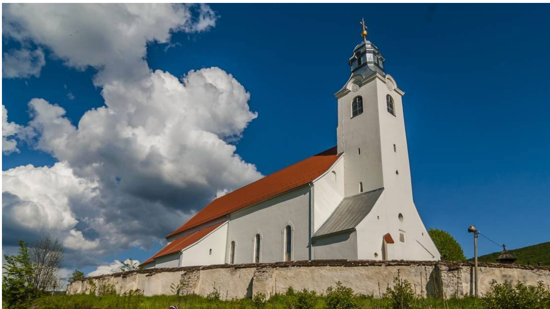
A Szent Péter és Pál Plébániatemplom Csíksomlyón.

Homoródszentpál is a népek apostola után kapta a nevét. Gyimesbükkben a templombúcsút már június 25-én, vasárnap megtartották. A csíksomlyói plébániatemplomban június 29-én 12.30-kor kezdődik a szentmise (szónok: Vass Nimród plébános), Székelyvarságon és Gyergyócsomafalván 12 órakor, Pálpatakán 13 órakor. Július 1-jén, szombaton 12 órától a Maros megyei Ehedben (szónok: Timár József szovátai segédlelkész) és Homoródszentpálon (szónok: Major Sándor kápolnásfalusi plébános) lesz a búcsús szentmise. Brassóban a Szent Péter és Pál-templom búcsúját június 29-én tartják: a román nyelvű szentmise 17, a magyar nyelvű 19 órakor kezdődik. Az említetteken kívül Székelyföldön a következő helységeken szenteltek templomot vagy kápolnát Szent Péter és Szent Pál apostolok tiszteletére: Csíksomlyó, Csíkmadaras, Gyimesközéplak (Jávárdi-hegy), Gyergyószentmiklós (Gyergyódomokos), Ikafalva, Kurtapatak, Magyarpéterlaka, Maroshévíz, Orotva, Kápolnásfalu, Székelyudvarhely (Ferencs templom