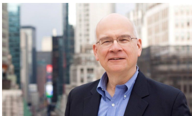
Kép 1

Timothy James Keller , 1950 szeptember 23-án született, Allentownban, Pennsylvániában. Legjobban úgy