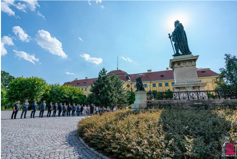
Koszorúzás és főhajtás a lovagkirály szobránál.

A nacionálkommunista rezsim, a Ceausescu-diktatúra 1989-ben bekövetkezett bukása után romániai magyar nemzeti közösségünk természetes életösztönrel és öntudatos bátorsággal hagyta maga mögött siralmas múltját, és vágott neki a reményteljes jövőnek. Ennek részeképpen szakított a történelemhamisító elnyomó rendszer hazugságaival, és fedezte fel hiteles múltját, hogy erőt és példát merítsen belőle.