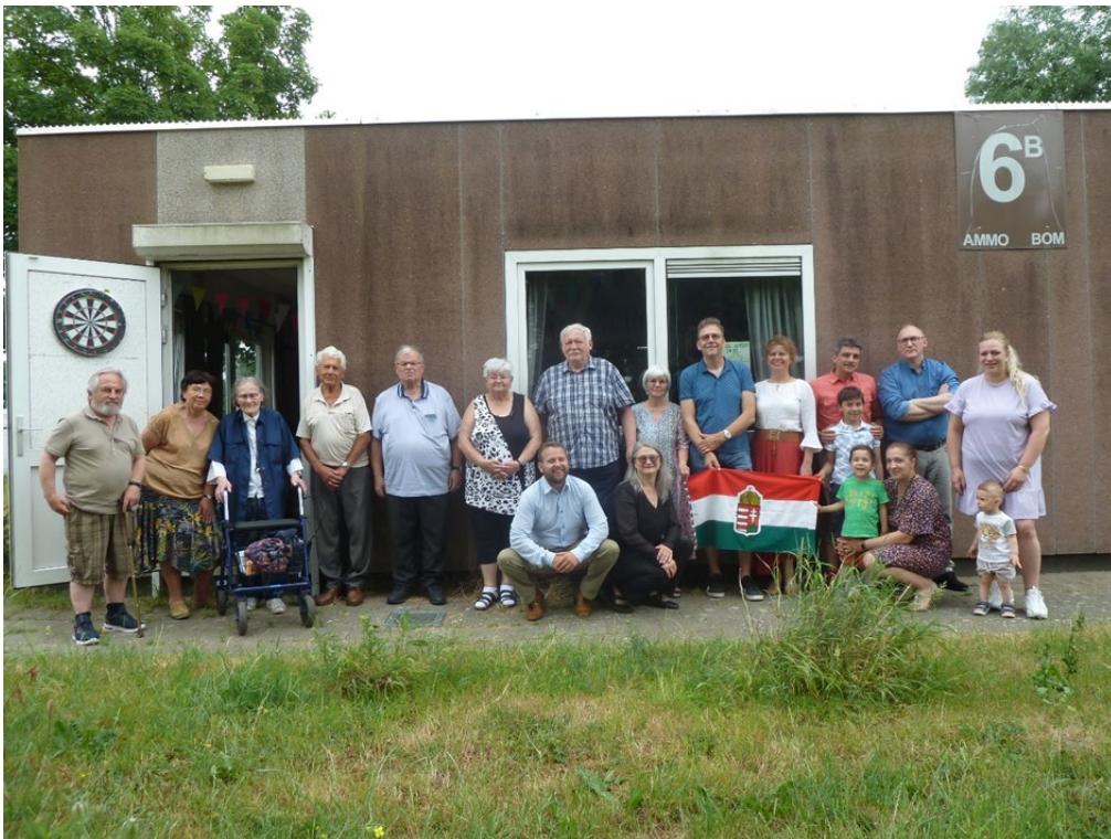
A hetedik vianeni istentisztelet csoportképe. 2023. június 18