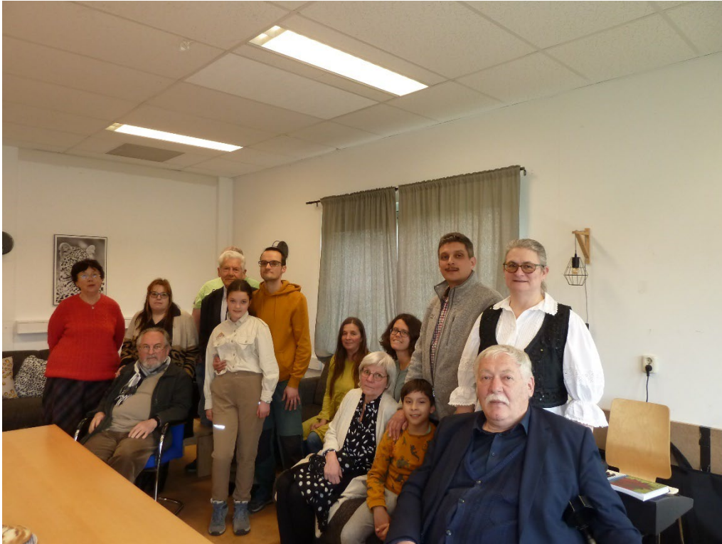
Vianen, az ötödik istentisztelet résztvevői, 2023. április 16