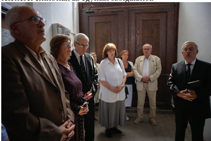
Az eseményre összegyűlt a család Kolozsváron.

Az Erdélyi Református Egyházkerületben Vásárhelyi János mellé püspöki titkárrá nevezték ki 1941-ben. 1946-tól 1973-ig az egyházkerület igazgatótanácsának tagja, 1952-ben az egyházkerület generális direktorává, 1974-től főjegyzőjévé választották. A tisztséget 1983-ig töltötte be. 1973-tól 1983-as kényszernyugdíjazásáig a kolozsvári Protestáns Teológia professzoraként az újszövetségi tanszéken tanított. 1989-ben a kommunista állam nyomására egyházi felettesei eltiltották az egyházi szolgálatól.