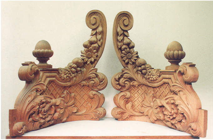
EIKEN SNIJWERK VOOR HET CONCERTORGEL IN DE LEBUINUSKERK, DEVENTER