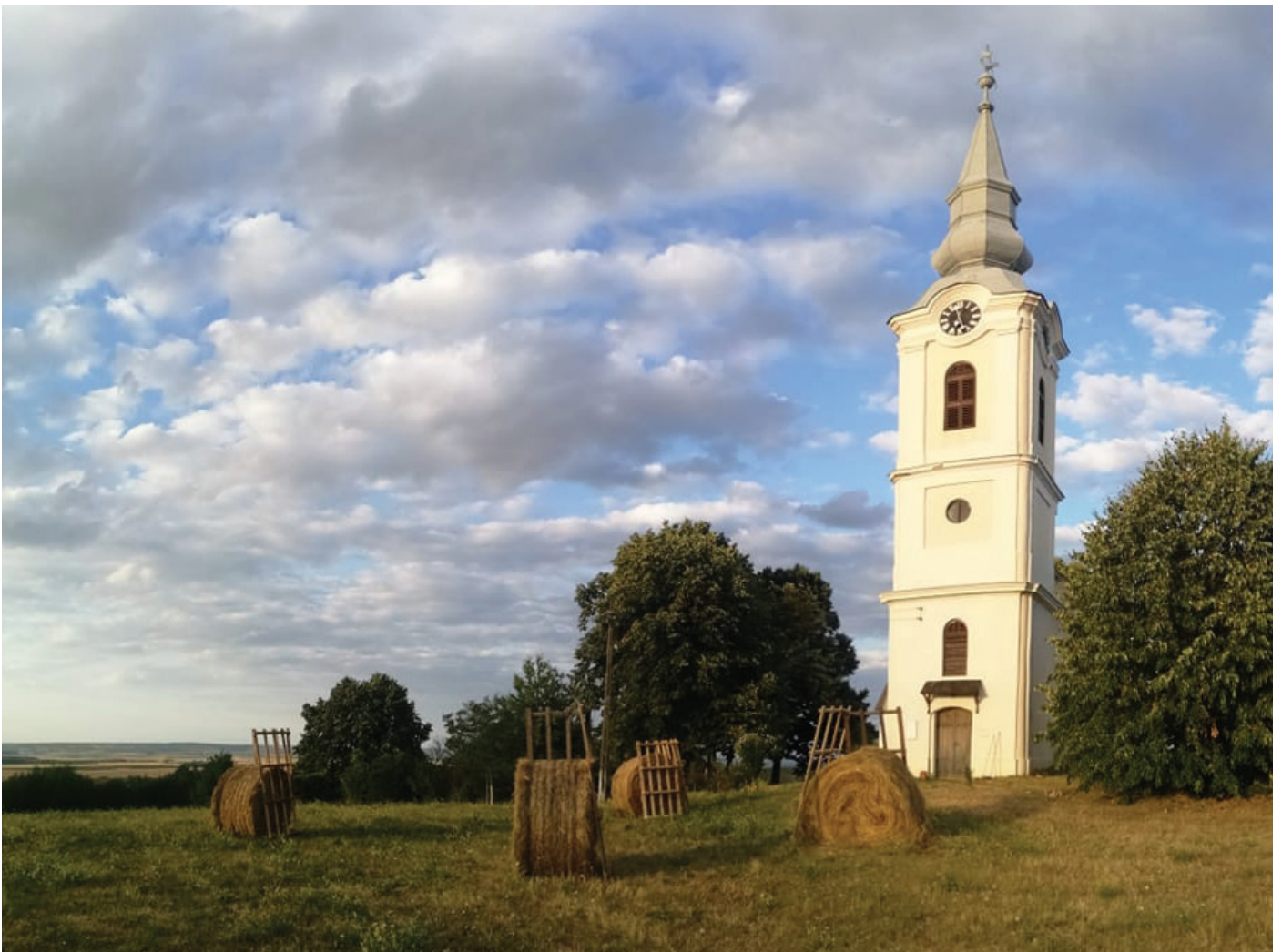
Siteri szabatéri galéria