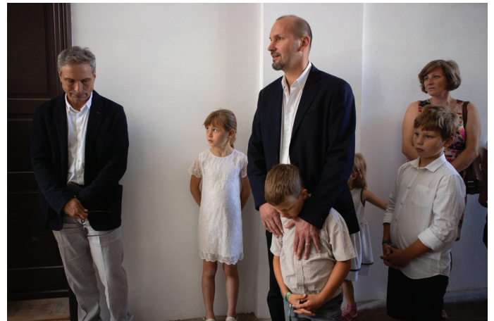
Az unokák Tőkés István születésének 105. évfordulójára időzítették az emléktábla állítását.

A szűk körben megtartott eseményen Kató Béla püspök a Zsolt 103,2 verssel köszöntötte az emlékezőket: „Áldjad, lelkem, az Urat, és ne feledd el, mennyi jót tett veled!” Felhívta a figyelmet arra, hogy Tőkés István olyan személyiség volt az erdélyi magyar közösség életében, hogy megérdemelné, hogy a nevét őrző tábla az utcára nézzen. Viszont olyan korban élünk, amikor sok tekintetben be kell vonulnunk intézményeinkbe, a falakon belül kell emlékeznünk, hogy megőrizhessük anyanyelvünket, identitásunkat. Kató Béla szerint figyelemre méltó, hogy nemcsak a gyerekek, hanem az unokák is megemlékeznek a néhai lelkipásztorról, tudósról, egyházi vezetőről, aki családfőként is olyan örökséget hagyott maga után, amelyet a mai generáció is értékelhet.