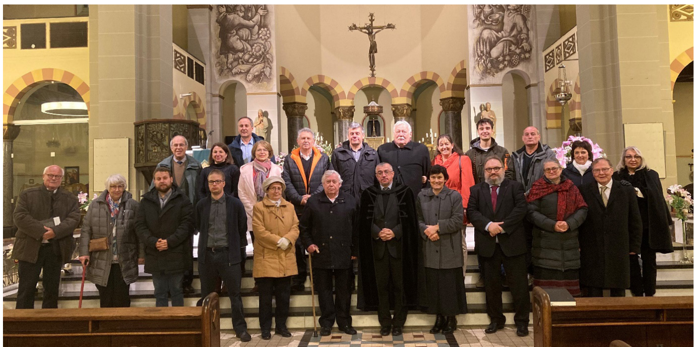
Az Utrecht 300 zárása. Hágai magyar református istentisztelet a Heilige Familie templomban. 2022 nov. 20.