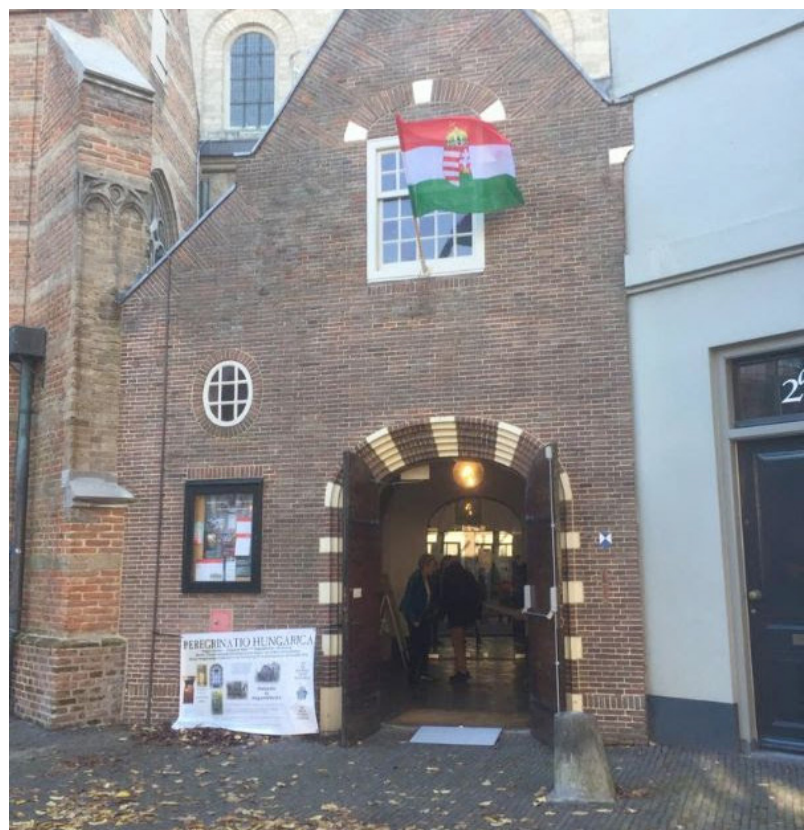
Utrecht, Pieterskerk

Ezek a fiatalok nem csak teológiát tanultak, hanem a magyar nyelvet is megtanulták. Megtapasztalták mit jelent keresztyén emberként és kisebbségként élni egy ateista diktatúrában. Ez a két év egész életüket megpecsételte, és majd az ún. 'Románitis'-vírusszal sok embert fertőztek meg.