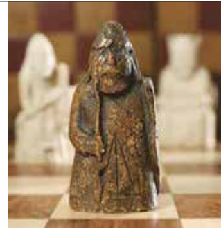
A rozsmáragyarból készült figuráról kiderült, hogy a középkori lewisi sakk-készlet hiányzó darabja

Egy edinburgh-i ház fiókjának mélyén évekig lapuló sakkfiguráról megállapították, hogy a lewisi sakkkészlet egyik darabja. A 12. vagy 13. században készült gyűjteményt 1831-ben a Lewis-szigeten találták meg, innen az elnevezés. A készletből még öt figura hiányzott – ez az „őr” pedig a bástya középkori megfelelője. A tulajdonos nagypapja 1964-ben 5 fontért vásárolta meg a rozsmáragyarból faragott figurát, de fogalma sem volt a faragvány történelmi jelentőségéről, sem az értékéről: a Sotheby's július elején aukcióra bocsátotta és 735 000 fontért adta el.