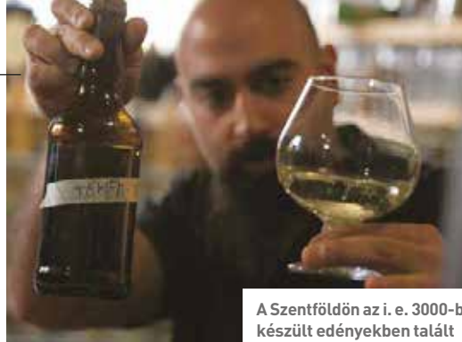
A Szentföldön az i. e. 3000-ben készült edényekben talált élesztőfajtákból készített „ősi” sör

Izraeli kutatók 5000 éves élesztővel főztek „ősi” sört. Hat fajta élesztőt vontak ki a Szentföldön található edényekből, és ezt használták föl a 6%-os alkoholtartalmú sör, valamint a 14%-os mézsör elkészítéséhez. „A fáraók korából ránk maradt sör propagandafogásától eltekintve, ez a kutatás nagyon fontos a kísérleti régészet szempontjából”, mondta Ronen Hazan mikrobiológus, majd hozzátette: „Egyébként a sör nem volt rossz.”