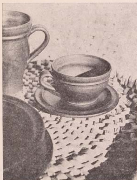
Probstner János munkája