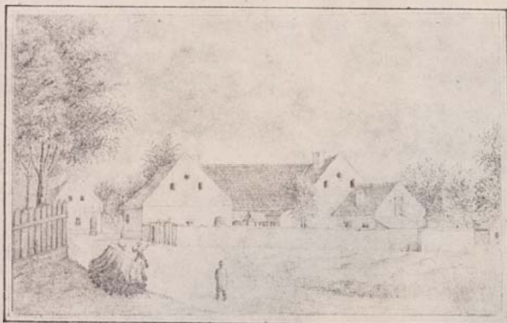
A SÁR-SZENT-LŐRINC-I ALGIMNÁZIUM. ITT TANULT PETŐFI 1831—1832

Az első az apai házat, feltehetően a rajzoló szülőházát ábrázolja a Lehr András Sopronba költözése utáni évből. Aláírása: „SÁR-SZENT-LŐRINC LEHR ANDRÁS LAKÓHÁZA 1831—1853 RAJZOLTA LEHR VILMOS 1854”. A 14 éves gyermek kezéből származó rajz rendkívüli rajz-készségről tesz tanúságot. Eddig még nem