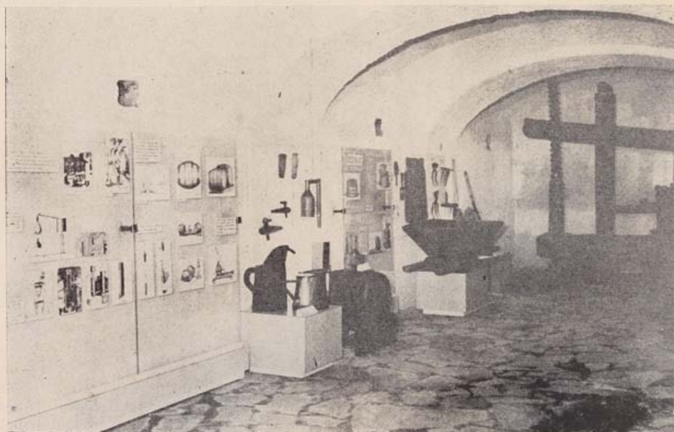
Részlet a borászati kiállításból

A már múzeumként működő magtárépületet és a hozzá tartozó múlt század eleji középfolyosós kukoricagörét az elkövetkező évek fokozatos helyreállításai munkálatai nyomán további épületrészek és kiállítások fogják követni. Ezek feladata a Dunántúl XVIII—XIX. századi mezőgazdaságának lehető legteljesebb megismertetése. A földművelés és állattenyésztés bemutatásán túl a múlt század mezőgazdasági gépeivel, cseléd- és kasznárlakásokkal találkozhat majd a látogató. Az épületek mögött elterülő több holdas kertben szőlő, gyümölcsös, a szántóföldi művelésben alkalmazott vetésforgók és virágos kert fogja felidézni a múlt század ele-