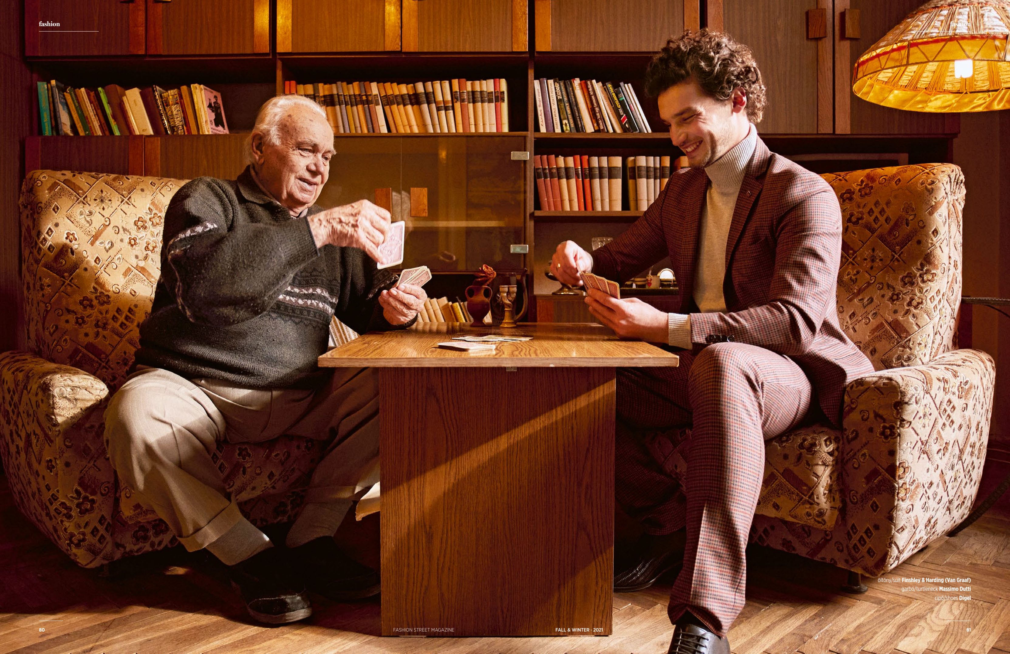
öltöny/suit Finshley & Harding (Van Graaf) garbó/turtleneck Massimo Dutti cipő/shoes Digel