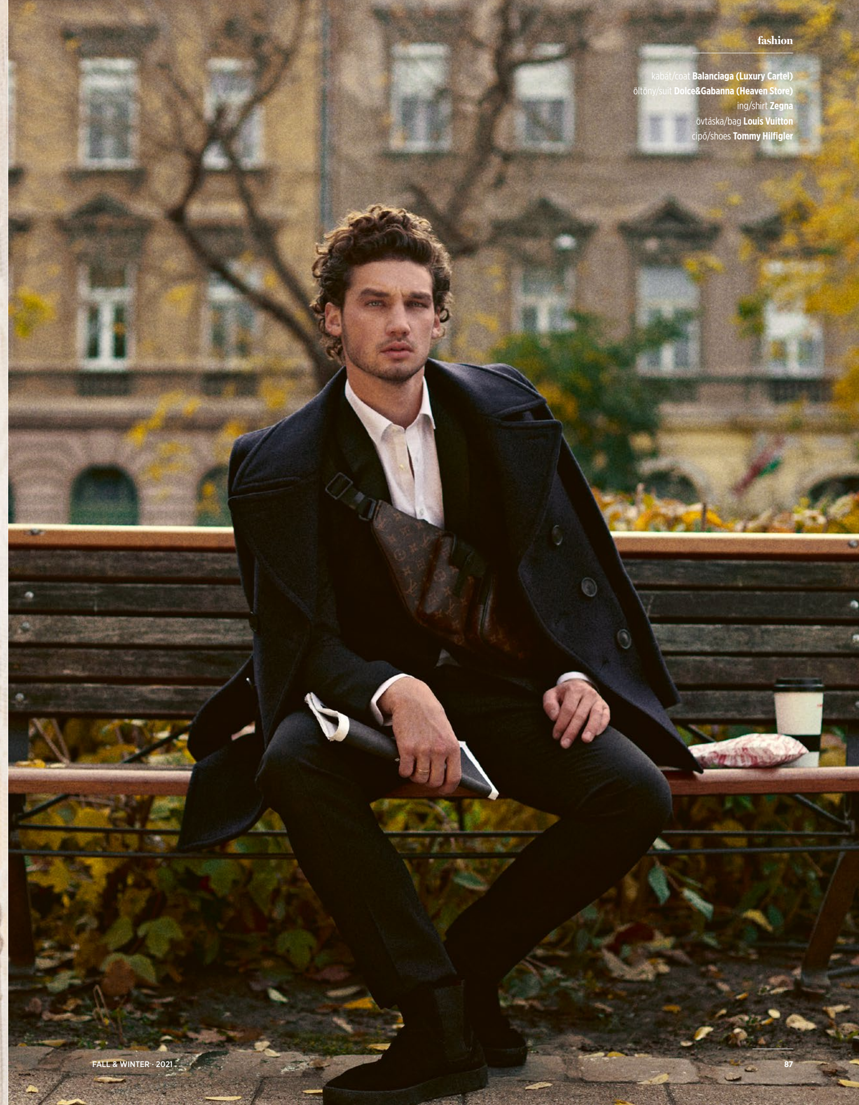
kabát/coat Balenciaga (Luxury Cartel) öltöny/suit Doice&Gabanna (Heaven Store) ing/shirt Zegna övtáska/bag Louis Vuitton cipő/shoes Tommy Hilfigler