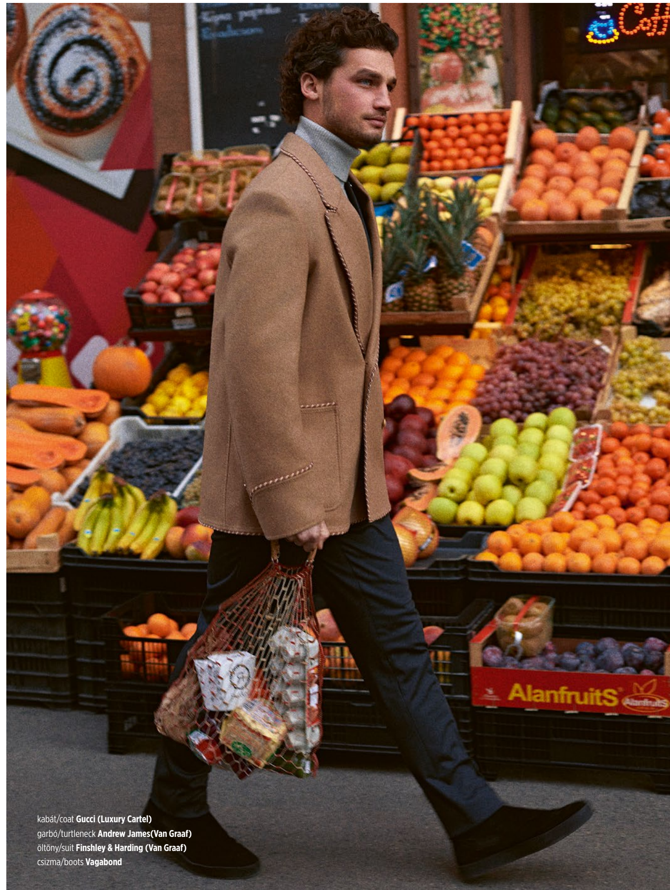
kabát/coat Gucci (Luxury Cartel) garbó/turtleneck Andrew James (Van Graaf) öltöny/suit Finshley & Harding (Van Graaf) csizma/boots Vagabond