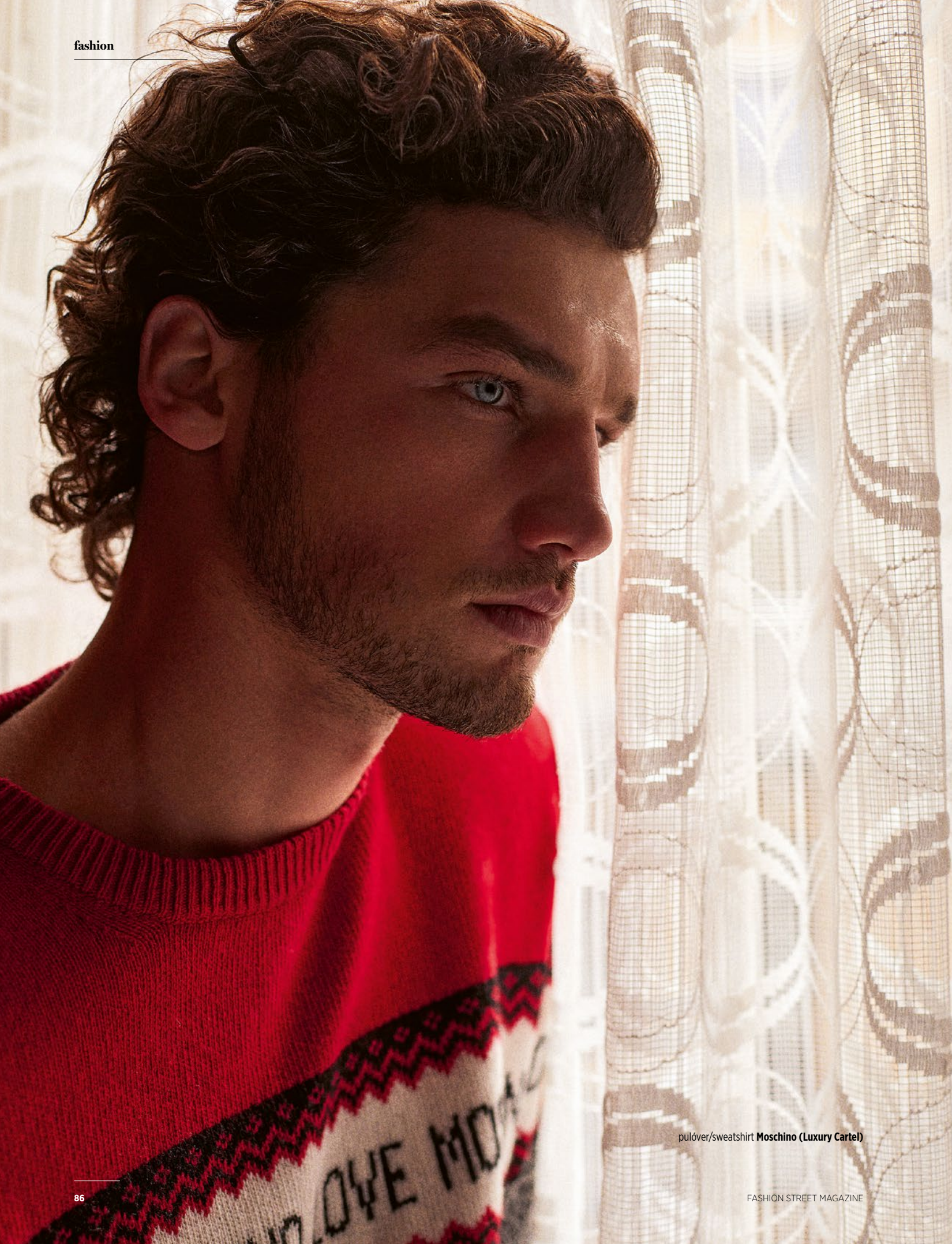
pulóver/sweatshirt Moschino (Luxury Cartel)