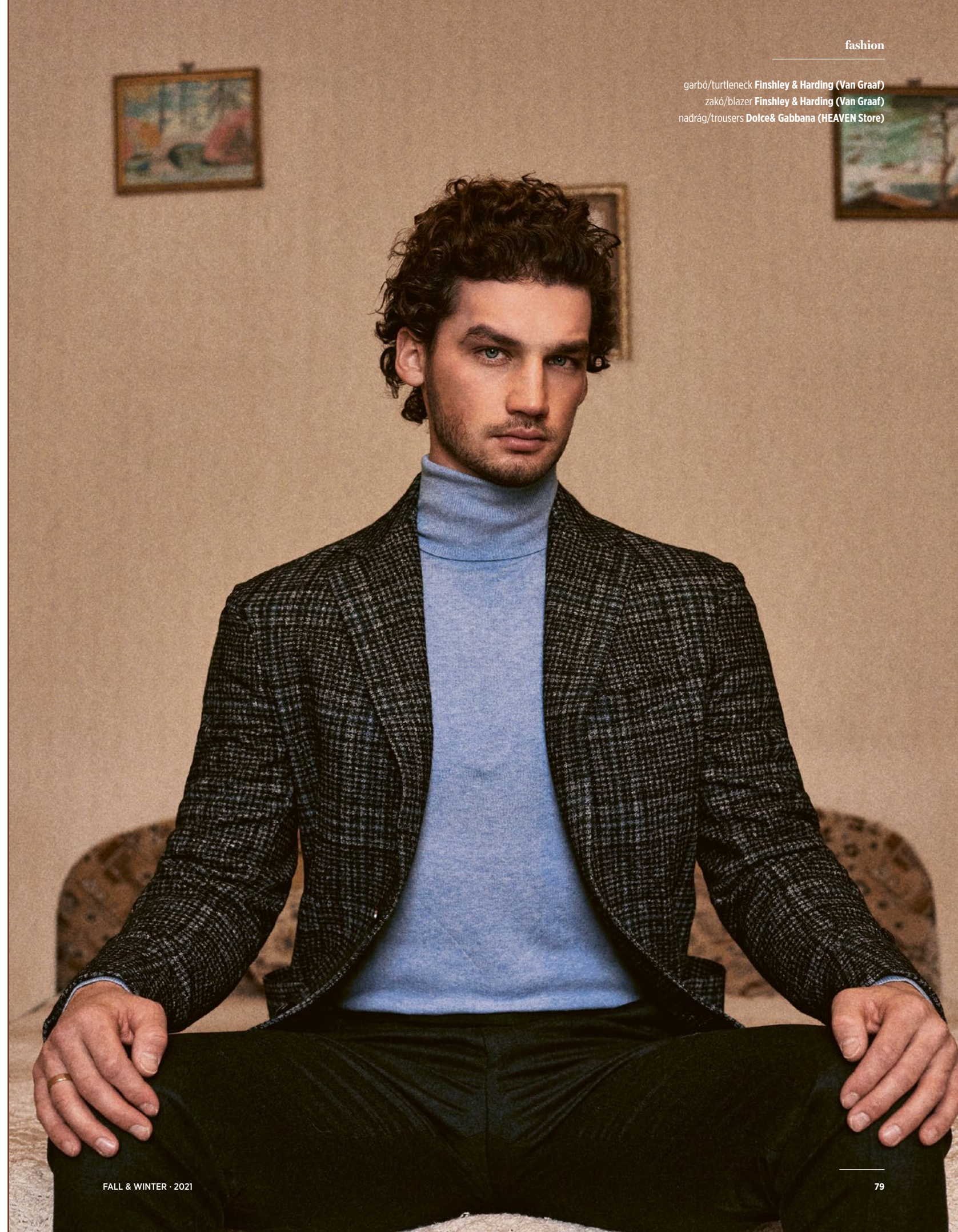
garbó/turtleneck Finshley & Harding (Van Graaf) zakó/blazer Finshley & Harding (Van Graaf) nadrág/trousers Dolce & Gabbana (HEAVEN Store)