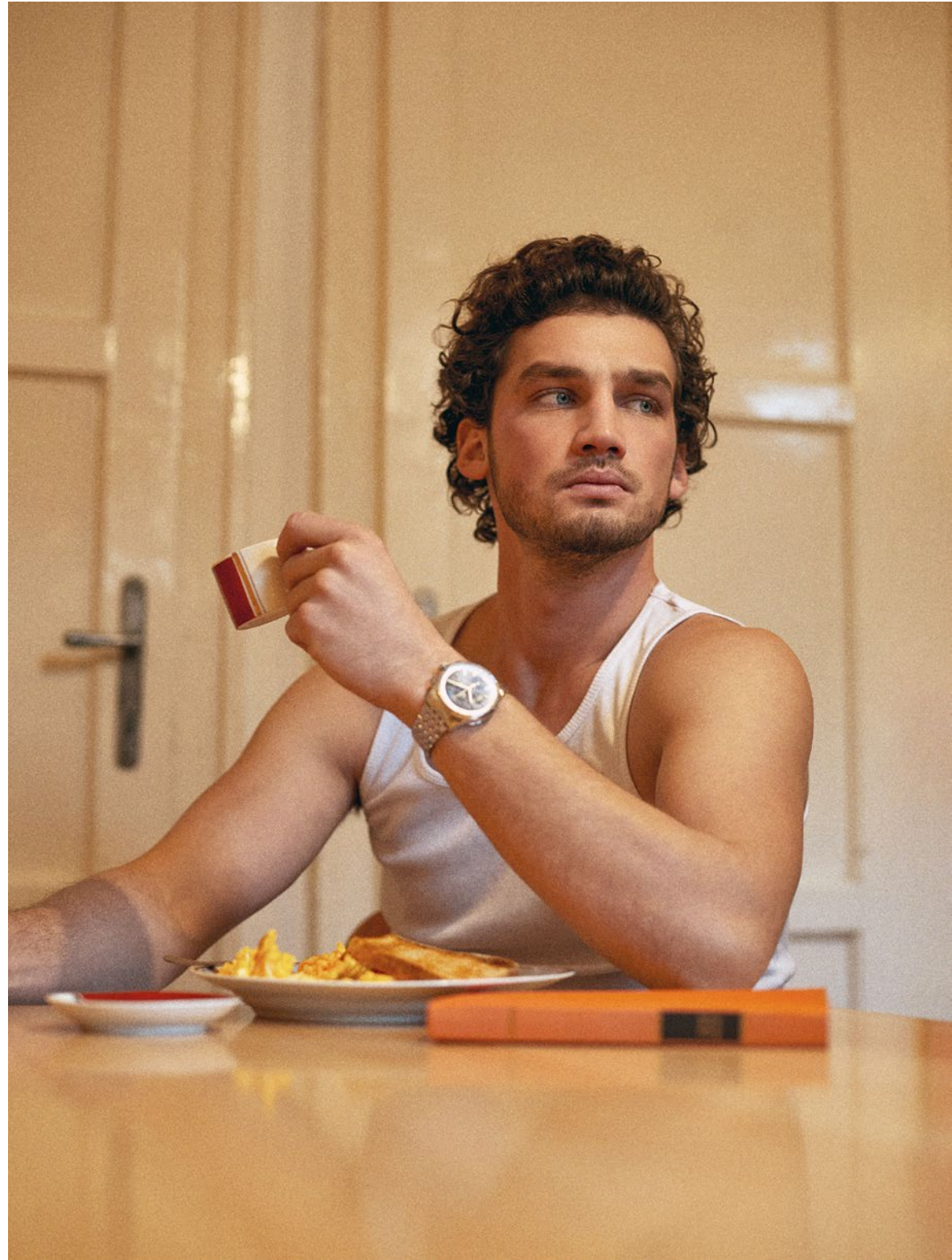
atléta/vest Intimissimi óra/watch Breitling