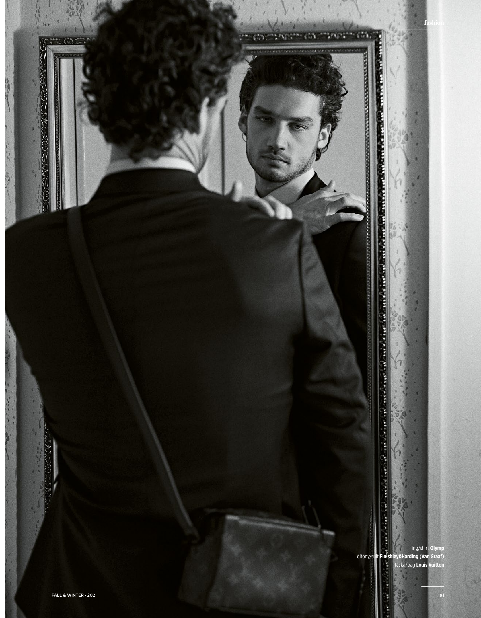
ing/shirt Olymp öltöny/suit Finisley&Harding (Van Graaf) táska/bag Louis Vuitton