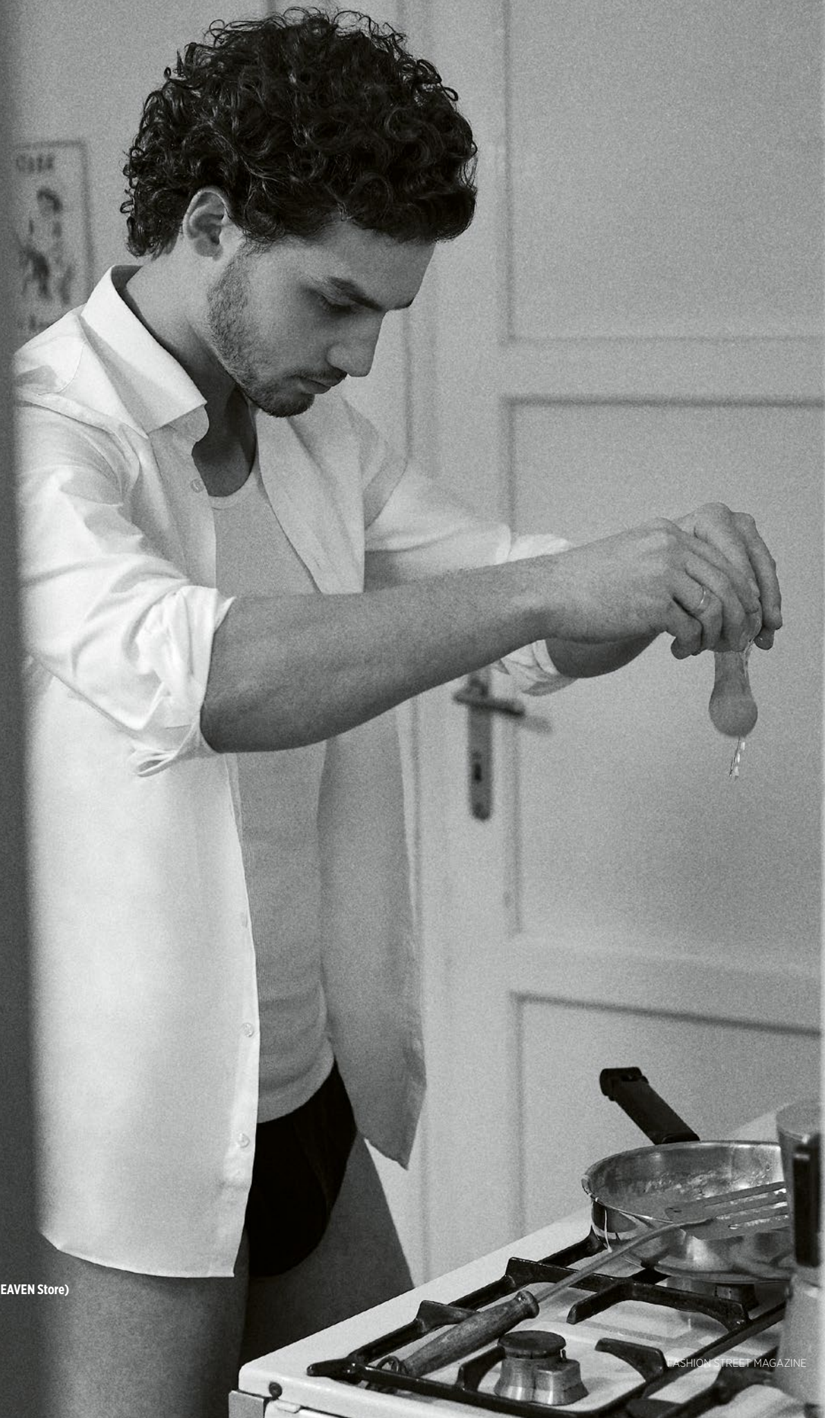
atléta/vest Intimissimi boxer Dolce&Gabbana ing/shirt Dolce&Gabbana (HEAVEN Store)