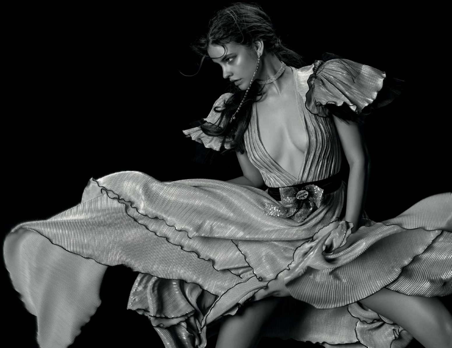
Ruha / Dress: Dora Abodi · Choker: Dora Abodi · Fülbevaló / Earrings: Dora Abodi