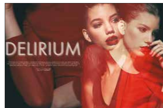
Felső Top Süel 4 900 Ft