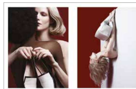
Cipő Shoes Hugo Boss 158 999 Ft