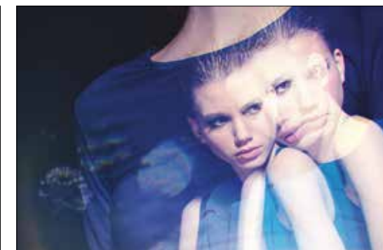
Felső Top Süel 4 800 Ft Felső Top Hugo Boss 78 000 Ft