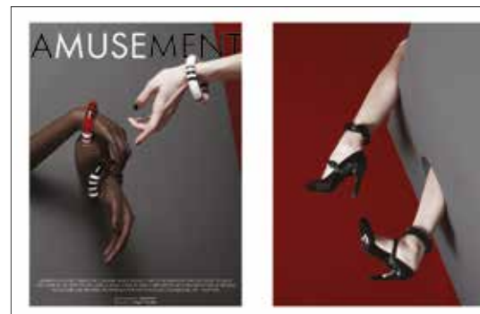
Karkötők Bracelets Furla 24 000 Ft/db