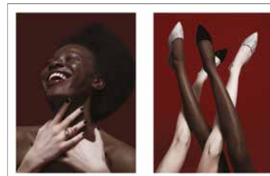
Gyűrűk Rings Piroskanna.com 18 000 - 120 000 Ft