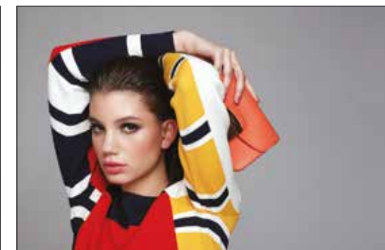
Pulóver Shirt Tommy Hilfiger 58 990 Ft Táska Bag Furla 78 500 Ft