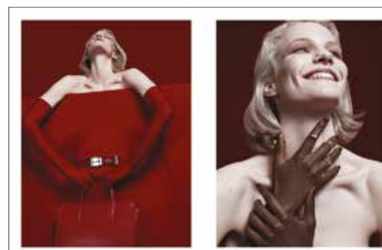
Öv Belt Lacoste 12 490 Ft Táska Bag Lacoste 83 990 Ft Kesztyű Gloves stylist sajátja stylist's own

WWW.ZADOR.COM INSTAGRAM.COM/ZADOROFFICIAL