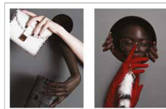
Táska Bags Furla 94 500 Ft