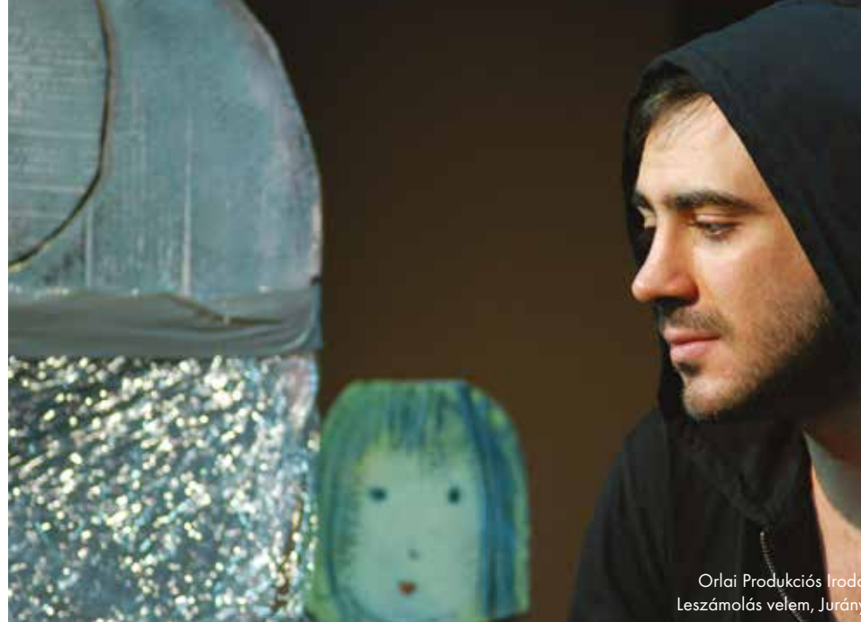
Orlai Produkciós Iroda: Leszámlolás velem, Jurányi

„Lehet, hogy közhelyesen hangzik, de én tényleg megélem a napokat. Igyekszem kimaxolni minden adódó lehetőséget: ha például adódik egy spontán buli, mondjuk, egy szállodában, már megyek is, és ha hajnali 4-kor ülhetek be jacuzzizni, egy másodpercig sem gondolkodom rajta. Próbálok úgy felfogni a helyzetet, mintha minden napom az utolsó lenne, és ezen irányvonal szerint élek. Szerencsésnek tartom magam, mert valahogy mindig úgy alakult az életem, hogy bevonzóttam ezeket az élményeket, és maximálisan éltem is velük.”