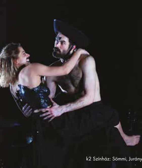
k2 Színház: Sömmi, Jurányi