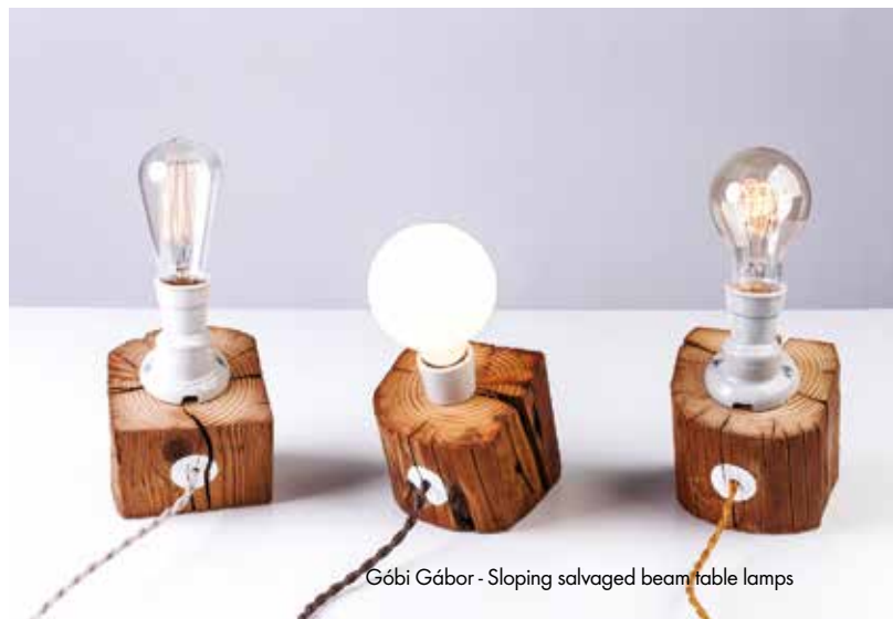
Góbi Gábor - Sloping salvaged beam table lamps

Az egyedi útkeresés választása ezért már önmagában hedonista: progresszív irányokat kipróbálni és bizonytalan befogadói oldallal tágítani az alkotói határokat – ez az ifjú magyar alkotók filozófiája 2017-ben. Természetesen szembejönnek a praktikus szempontok, melyek folytán olykor inspiráló vállalkozások sikkadnak el – de legyen az bármilyen alkotói terület, aki kitart, és végigjárja ezt az utat, az igazán egyedi és maradandó értéket képes létrehozni.