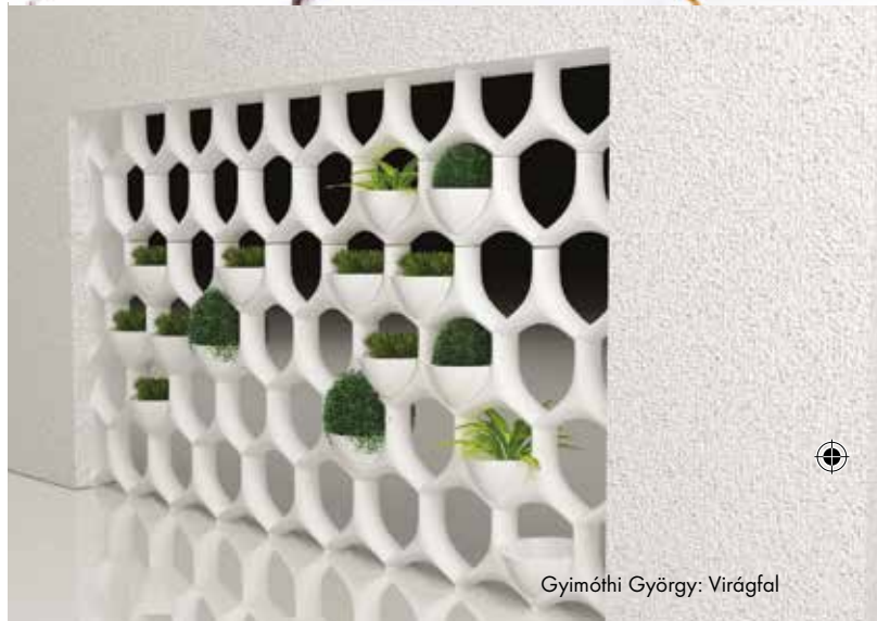
Gyimóthi György: Virágfal