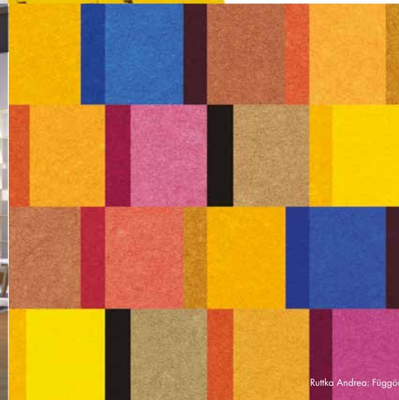
Rutka Andrea: Függyöny