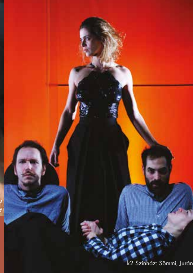
k2 Színház: Sömmi, Jurányi

„Minden tárgyalatás más-más személyiség: van, akit a minimál pragmatizmus megteremtése iránti vágy hajt, és akad, akit képzőművészeti hajlamai irányítanak. Így egy tárgy hedonista tartalmai mindenképpen komoly