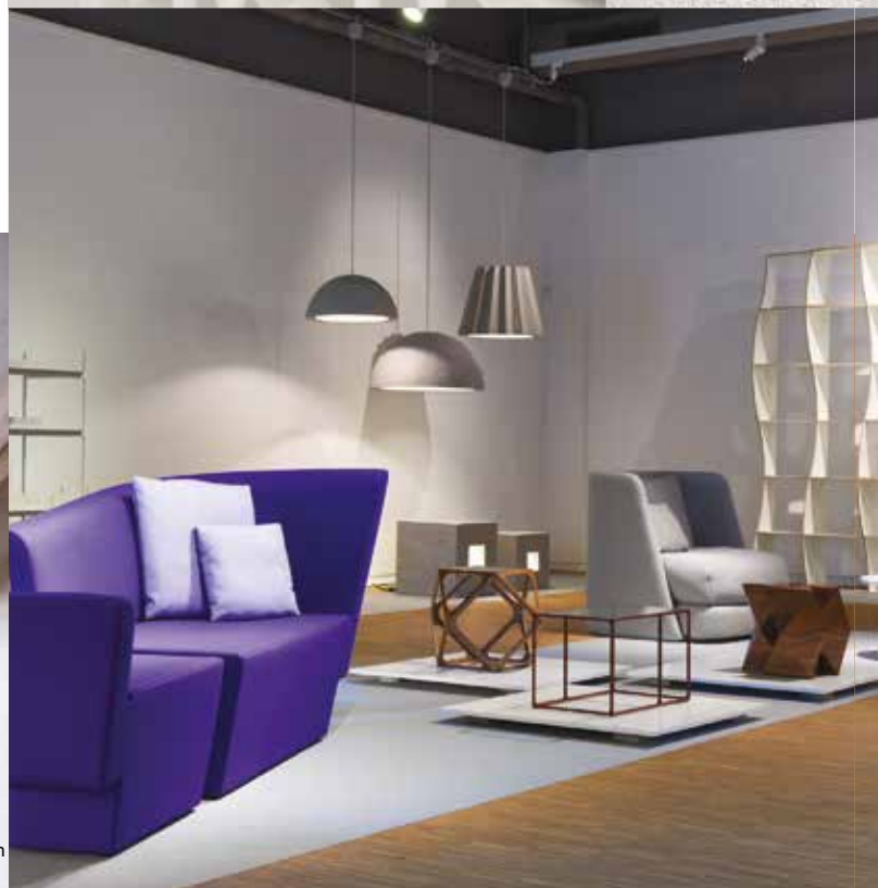
Tillinger Adrienn: Objects Within