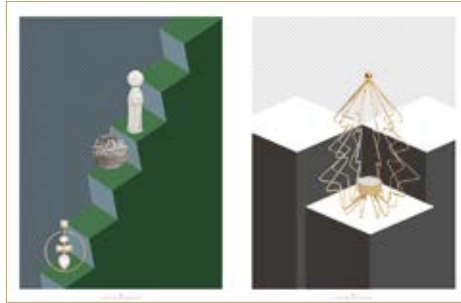
Fülbevaló Earring Cadenzza 32 900 Ft Fülbevaló Earring Oscar de la Renta/Cadenzza 92 900 Ft Karácsonyfa dísz Christmas Ornament Zara Home 3 995 Ft Mécesstartó Tealight Zara Home 3 995 Ft