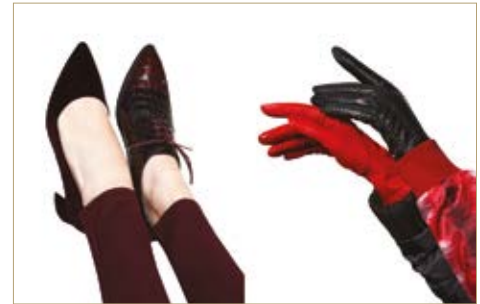
Nadrág Trousers Lacoste 34 880 Ft Bal cipő Shoe-L Kitten/Office Shoes 11 990 Ft Jobb cipő Shoe-R Lloyd 49 990 Ft