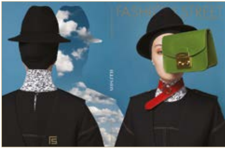
Kalap Hat Massimo Dutti 14 995 Ft Ing Blouse Lacoste 34 880 Ft Felső Top Nanushka 55 000 Ft Mellény Waistcoat Nanushka 87 000 Ft Öv Belt Lacoste 25 280 Ft Táska Bag Furla 78 500 Ft