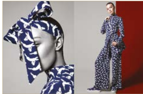
Fejpánt/Öv Headband/Belt Nanushka 95 200 Ft Ing Blouse Nanushka 58 000 Ft Overall Jumpsuit Nanushka 95 200 Ft Cipő Shoes Nanushka 64 400 Ft Táska Bag Nanushka 49 500 Ft