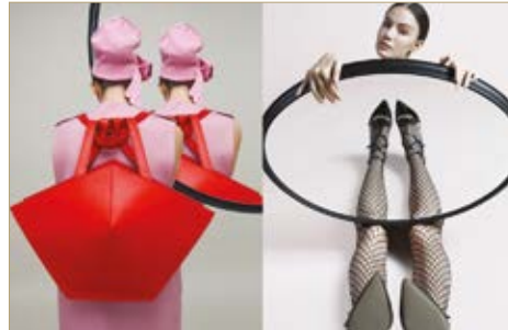
Kesztyű és sapka Glove and Hat Lacoste 18 800 Ft Mellény Waistcoat Nanushka 87 700 Ft Táska Bag Wink 59 990 Ft