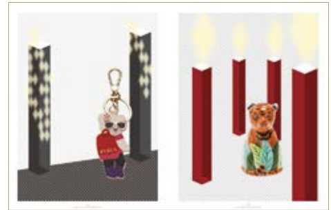
Kulcstartó Keyring Furla 19 500 Ft Sószóró Salt shaker Zara Home 2 995 Ft