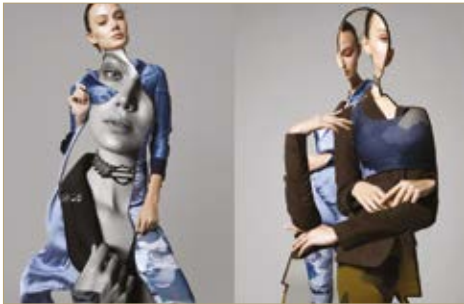
Melegítőnadrág Sweatpants Nike 18 999 Ft Legging Legging Oysho 9 995 Ft Blézer Blazer Massimo Dutti 29 995 Ft Sportmelltartó Sport Bra Oysho 7 995 Ft Ing Blouse Massimo Dutti 17 995 Ft Hálóing Nightdress Oysho 7 995 Ft Nyaklánc Necklace Harley Davidson 33 700 Ft Kitűző Brooch Harley Davidson 3 720 Ft