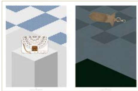
Táska Bag Furla 205 000 Ft Kulcstartó Keyring Furla 26 000 Ft