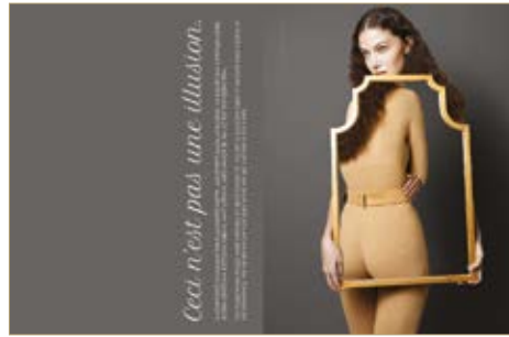
Felső Top Nanushka 45 500 Ft Nadrág Trousers Nanushka 75 000 Ft Tükör Mirror Zara Home 22 995 Ft