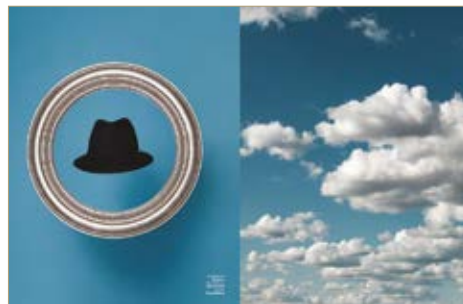
Kalap Hat Massimo Dutti 14 995 Ft Tükör Mirror Zara Home 22 995 Ft