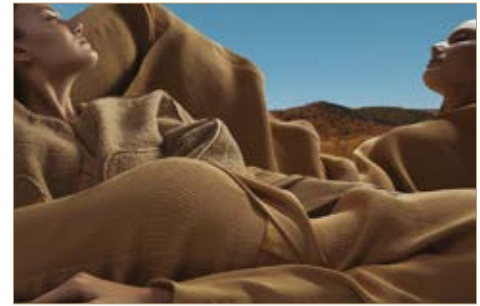
Nadrág Trousers Nanushka 75 000 Ft Felső Top Nanushka 79 800 Ft Kabát Coat Nanushka 375 000 Ft