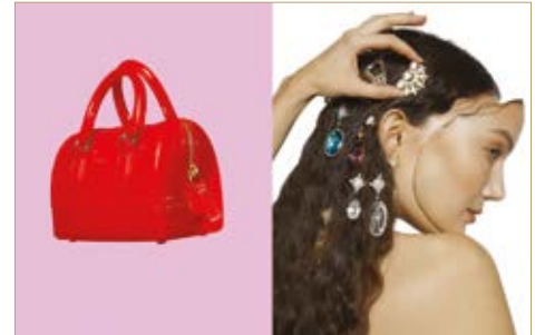
Táska Bag Furla 46 500 Ft