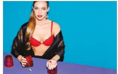
Fülbevaló Earrings Helen Zubeldia/Cadenzza 164 900 Ft Melltartó Bra Intimissimi 9 490 Ft Gyűrű Ring Cadenzza Couture 29 900 Ft Gyűrű Ring Eddie Borgo/Cadenzza 49 900 Ft Gyűrű Ring Oscar de la Renta/Cadenzza 64 900 Ft Gyűrű Ring Versace/Cadenzza 42 900 Ft Gyűrűszett Ring Set Ted Baker/Cadenzza 19 900 Ft Gyűrű Ring Versace/Cadenzza 94 900 Ft Poharak Glasses Zara Home 1 495 Ft