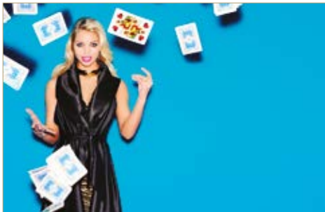
Nyaklánc Necklace Casha for Cadenzza 64 900 Ft Ruha Dresses Süel 10 900 Ft Gyűrű Ring Versace/Cadenzza 94 900 Ft Karkötő Bracelet Les Georgettes/Cadenzza 34 900 Ft Karkötő Bracelet Les Georgettes/Cadenzza 39 900 Ft Szoknya Skirt Massimo Dutti 17 995 Ft