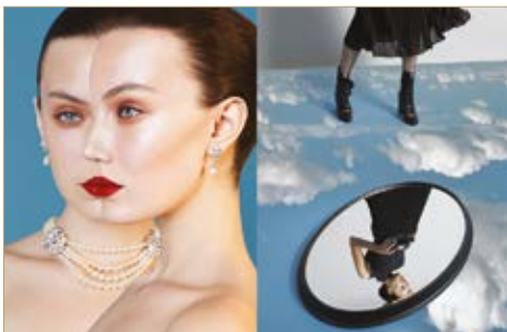
Nyaklánc Necklace Ben Amun/Cadenzza 99 900 Ft Fülbevaló Earrings Ben Amun/Cadenzza 24 900 Ft Szoknya Skirt Massimo Dutti 22 995 Ft Felső Top Nike 33 990 Ft Harisnya Tights Oysho 2 995 Ft Bokacsizma Kitten/Office Shoes 21 990 Ft Táska Bag Furla 70 500 Ft Tükör Mirror Zara Home 22 995 Ft