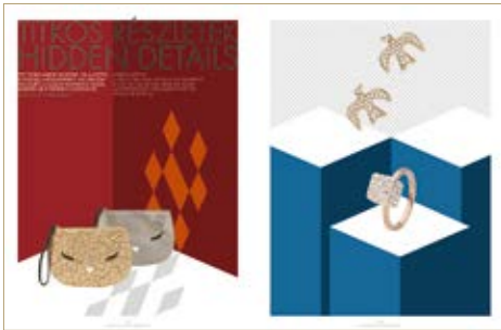
Pénztárca Purse Furla 35 500 Ft Pénztárca Purse Furla 35 500 Ft Fülbevaló Earrings Nina Ricci/Cadenzza 29 900 Ft Gyűrű Ring Cadenzza 19 900 Ft