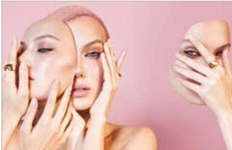
Gyűrű Ring Furla 19 500 Ft