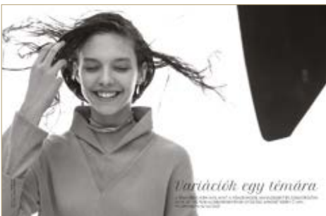
Felső Top Nanushka 79 800 Ft Felső Top Nanushka 45 500 Ft Nyakpánt Choker Furla 38 500 Ft Fülbevaló Earring Tom Shot Berlin/Cadenzza 12 900 Ft