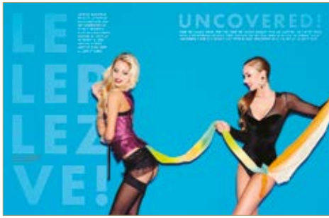
Felső Top MTVA jelmeztár MTVA costume store Bugyi Panties Intimissimi 5 490 Ft, Harisnyatartó Suspender Belt Intimissimi 8 490 Ft,