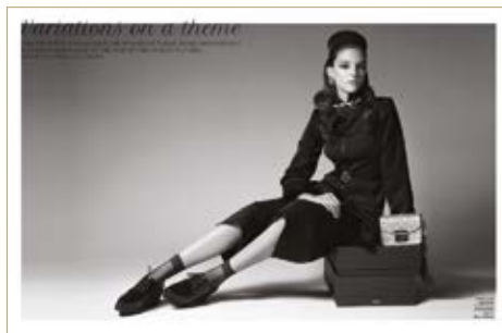
Nadrág Trousers Nike 21 999 helyett 10 990 Ft Felső Top Nanushka 78 000 Ft Mellény Waistcoat Nike 33 990 Ft Öv Belt Lacoste 25 280 Ft Cipő Shoes Kitten/Office Shoes 15 990 helyett 11 190 Ft Hajpánt Headband Lacoste 2 600 Ft Táska Bag Furla 85 000 Ft Kulcstartó Keyring Furla 21 000 Ft Nyaklánc Necklace Helene Zubeldia/Cadenzza 124 900 Ft Klipsz fülbevaló Clip-on earring Anton Heunis 49 900 Ft