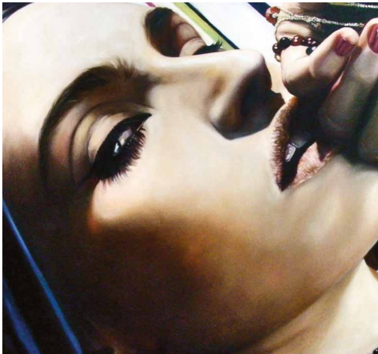
Órák óta nem eszem, 2013, olaj, vászon, 40 x 40 cm / I haven't eaten for hours, 2013, oil on canvas, 40 x 40 cm