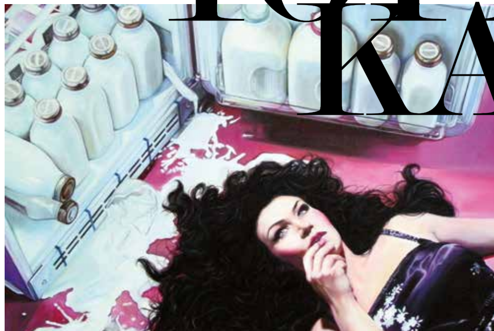
Élet, erő, egészség, 2012, olaj, vászon, 70 x 100 cm Life, Strength, Health 2012, oil on canvas, 70 x 100 cm