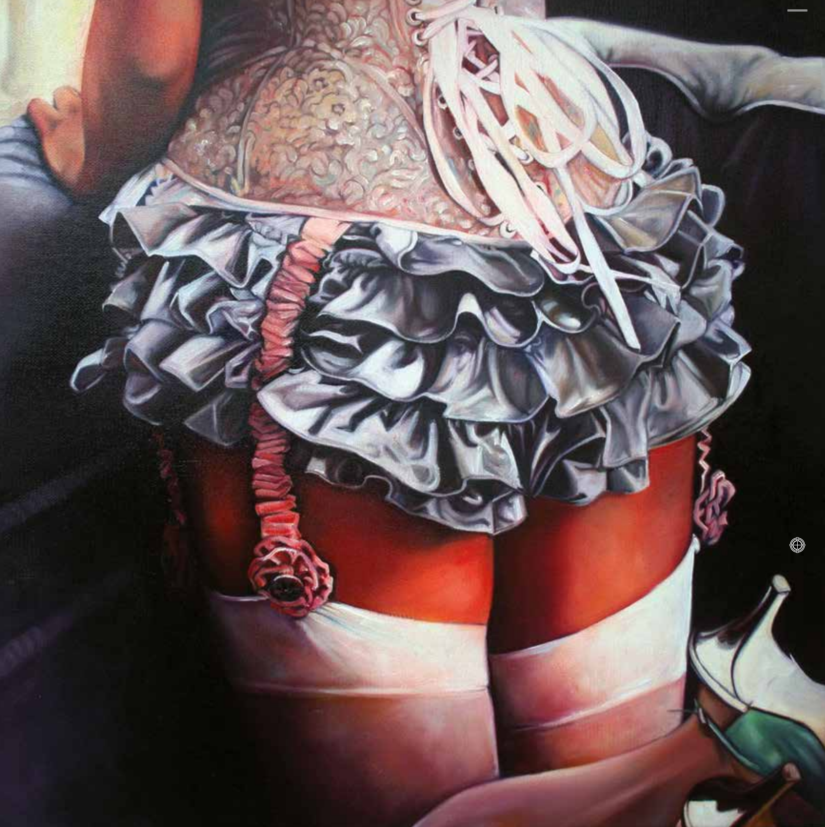
Barázdabillegető, 2011 olaj, vászon, 40 x 40 cm / Motacilla Alba, 2011, oil on canvas, 40 x 40 cm