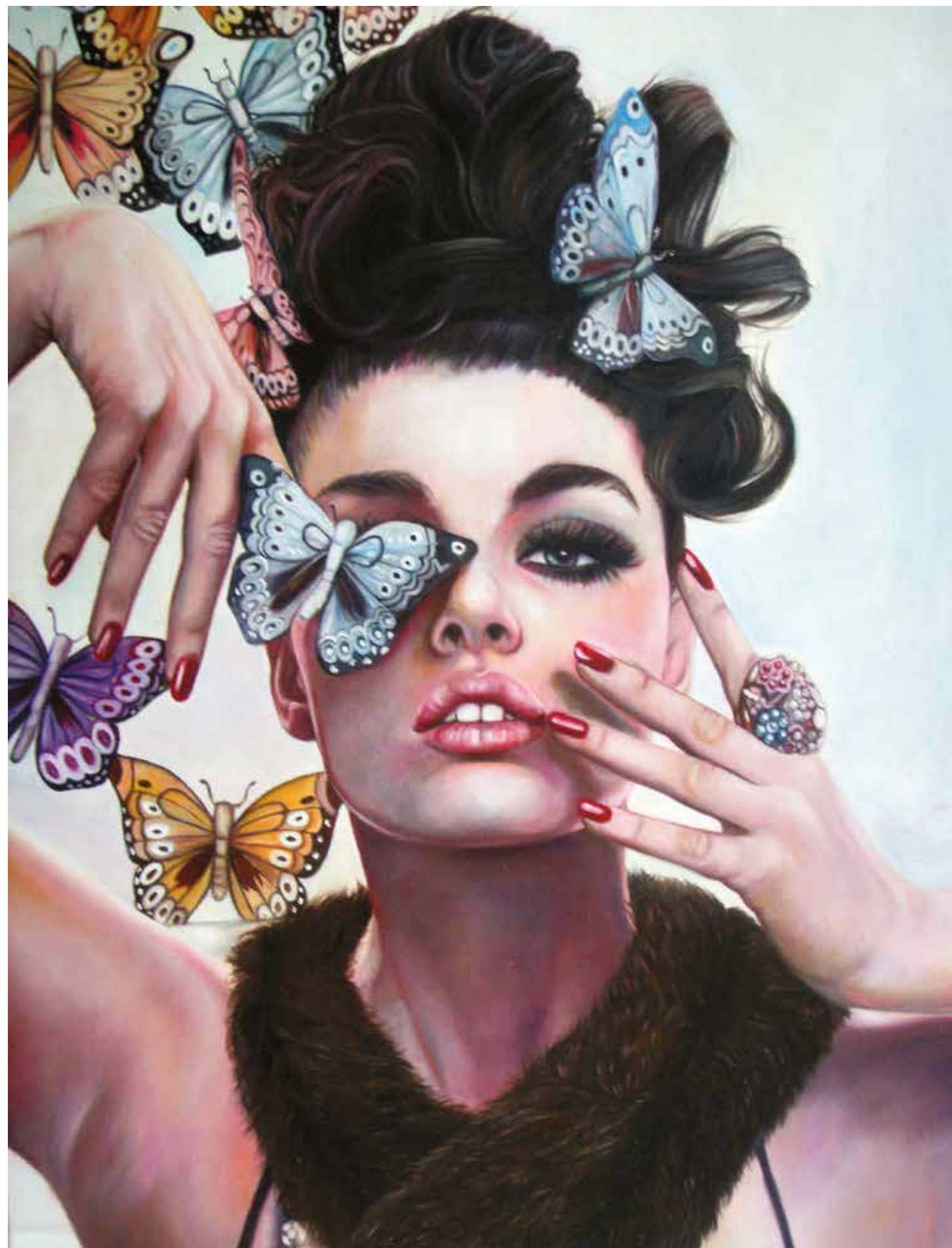
Pillangókasszony, 2011, olaj, vászon, 70 x 50 cm / Madame Butterfly, 2011, oil on canvas, 70 x 50 cm

How do you find the photographs? I simply surf the web and when I find something I like, I simply paint it. This is how I bumped into the works of Miles Aldridge, the fashion photographer.