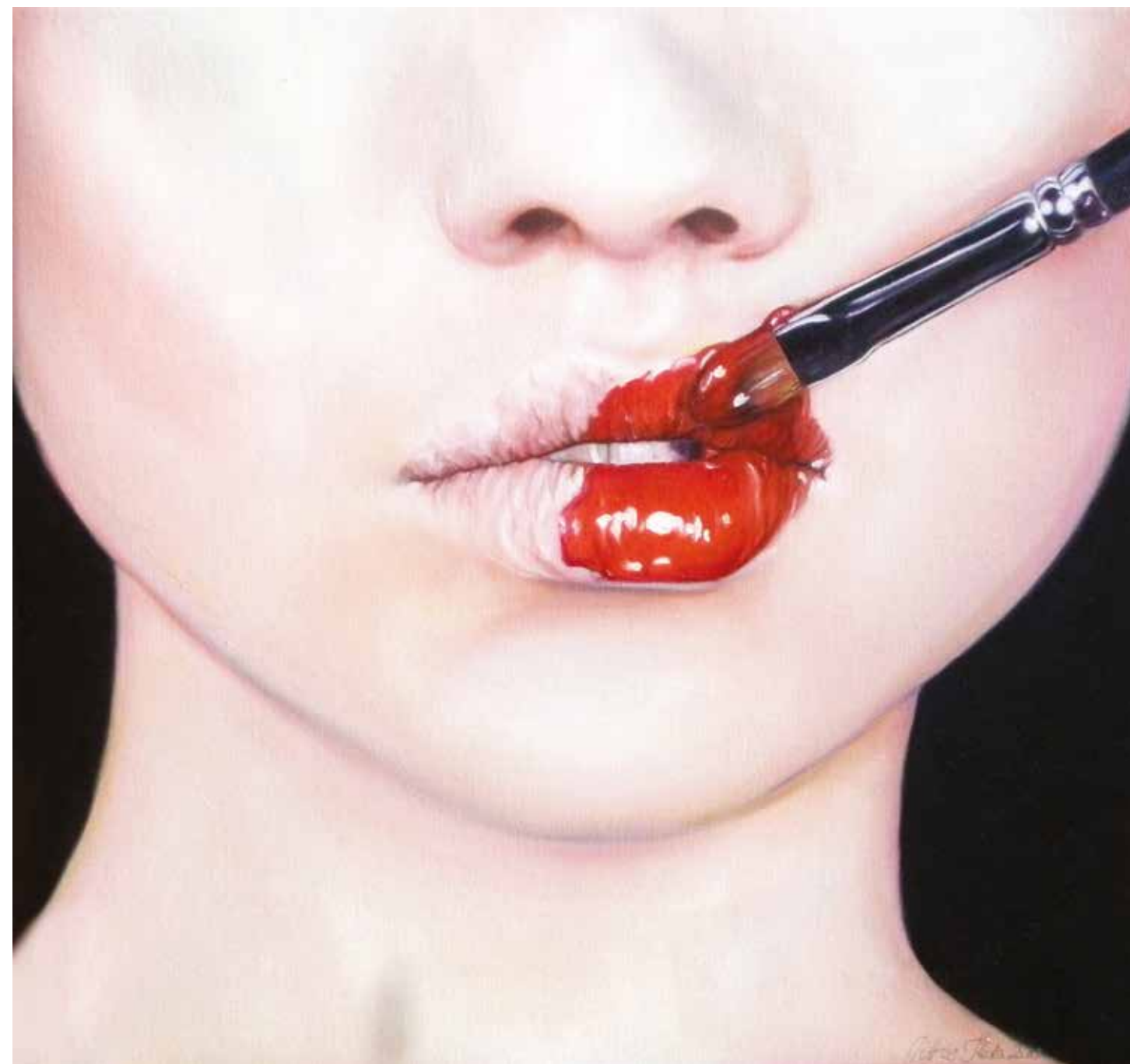
Rózs, 2012, olaj, vászon, 40 x 40 cm / Rouge, 2012, oil on canvas, 40 x 40 cm

Szép bőre van, nagy szeme, hosszú szempillája. Fontos a külső, és a bensőjével is rendben van. Régebben sok képemnél kérdezték, hogy önarcképek-e. Tudat alatt minden művész belefesti magát egy kicsit a műveibe.