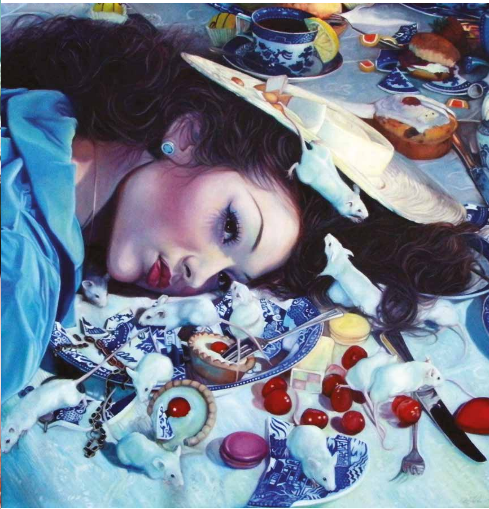
Az alkoholizmus súlyos mellékhatásai, 2011, olaj, vászon, 80 x 80 cm / The serious side effects of Alcoholism, 2011, oil on canvas, 80 x 80 cm