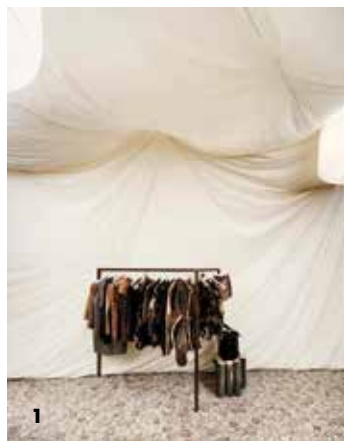
1-2: Nanushka üzlet, 2011 Budapest The Flagship Store for Nanushka 2011 Budapest 3: ARYS mobiltelefon-alkalmazás, Global Startup ARYS mobil app Global Startup