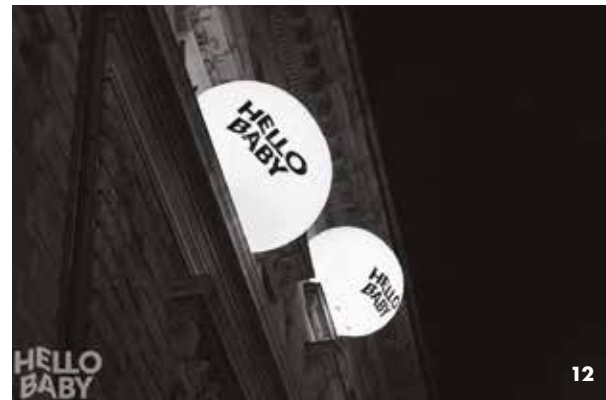
9-10: Benedict & Helfer iroda Interior for Benedict & Helfer Office 11-12: Hello Baby Bar, Andrásy út, Budapest Hello Baby Bar, Andrásy Avenue, Budapest