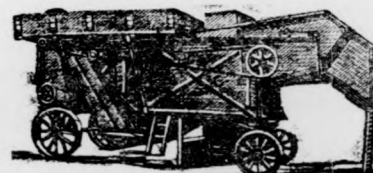
M. Á. V. Cs éplőgarnitúrák