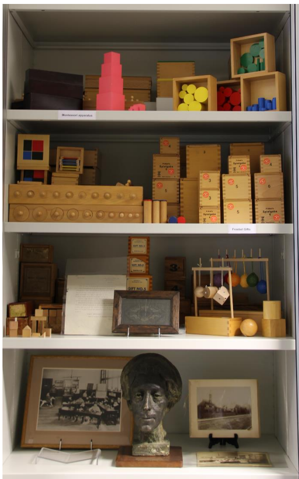
6. kép. Mini kiállítás a Fröbel Archívumban. University of Roehampton, Archives and Special Collections, Froebel Archive for Childhood Studies

helyezve, emeltek ki különböző történeti témákat. Nevin és Behr a projektet összefoglaló tanulmányából (BEHR – NEVIN, 2018) következnek néhány kiragadott téma. A helyi tanárképzés története, a neveléspolitikai történetébe ágyazható... A kampuszon található műemlékek, épületek tanulmányozása a társadalmi hierarchia, osztályok és privilégiumok tanulmányozásához is elvezet... A katolikus emlékeken keresztül a közösség nevelésben betöltött szerepe is kiviláglik... Az arts and crafts mozgalom műalkotásai és dokumentumai biográfiai kutatásokhoz is szolgáltathatnak fontos adalékokat.