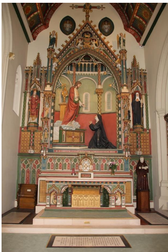
3. kép. Szent Szív kápolna. Sacred Heart Chapel.

1841-ben alapított az anglikán The Church of England's National Society női tanárképző főiskolát Whitelands néven, amely 2005-ben költözött a kampusz területére. 5 Ez utóbbi főiskola szorosan kapcsolódik az arts and crafts mozgalomhoz. A négy főiskola 1975-ben egyesült, 2004-ben egyetemi rangot kapott. Az iskolák a tanítónő- és tanárnőképzés fellegvárai.