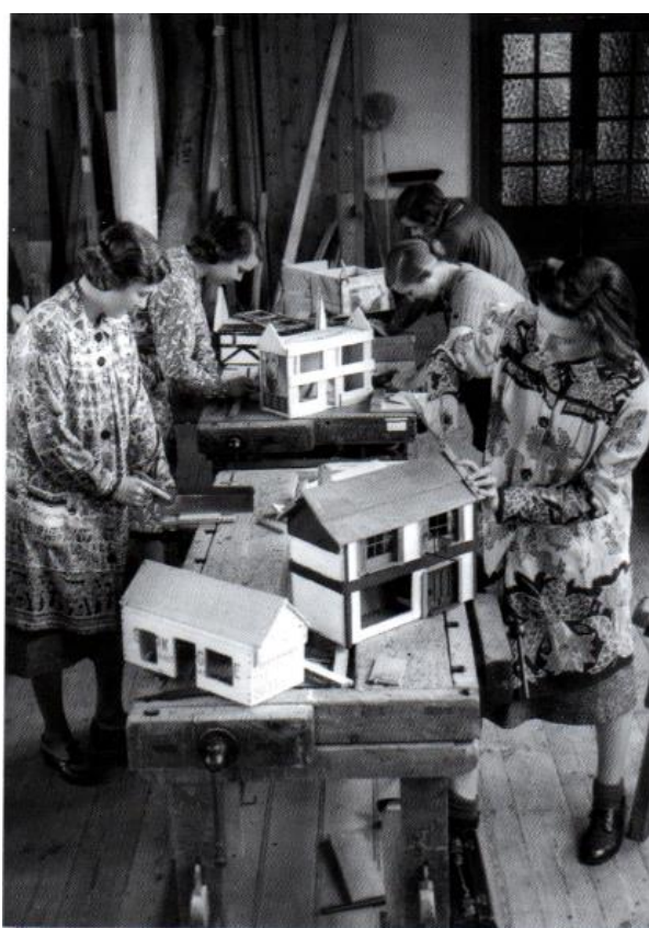
A Handwork class, 1930s

London Roehampton városrészében, a mai egyetem területén, elsőként a római katolikus Sacré Coeur rend alapította meg első iskoláját 1850-ben. A tanítónőképzés 1874-ben kezdődött. 2 A Friedrich Fröbel reform elveit követő Froebel Educational Institute 1892-ben kezdte meg az óvónők képzését. A jelenlegi, roehamptoni kampuszra 1921-ben költöztek. 3 A Southlands College jogelődje 1872-ben kezdte meg a tanárnők képzését második metodista képzőhelyként. Az intézmény 1997-ben költözött Roehamptonba. 4