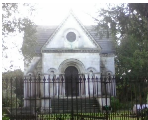
7. kép. Síremlék az egyetem bejárata mellett

A Gilly King vezette kampusztúrákon a diákok olyan, általában lezárt, területeire is eljuthattak egyetemüknek, ami izgalmas adalékokkal szolgált a terület korábbi tulajdonosairól, vagy