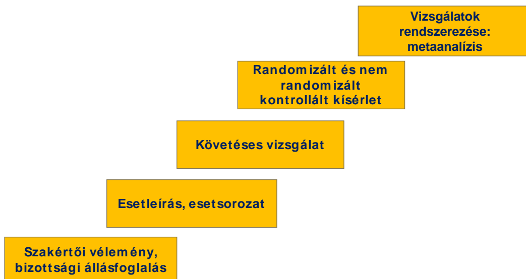
2. ábra. A bizonyítékok szintjei (Pintér, 2019)

gyaiba, illetve a tudományos diákköri munka megalapozott intervenciókutatásaihoz. Ehhez figyelembe vettük a bizonyítékok szintjeit a szakértői véleménytől a metaelemzésig. A bizonyítékok szintjeit a 2. ábra szemlélteti. (Pintér, 2019)